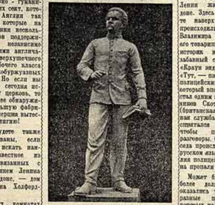
«Молодой Ленин». Скульптура Шандора ВАРАДИ (Венгрия).

Великий Ленин на минуту не забывал о нуждах трудящихся бакинского Азербайджана и всего Закавказья.