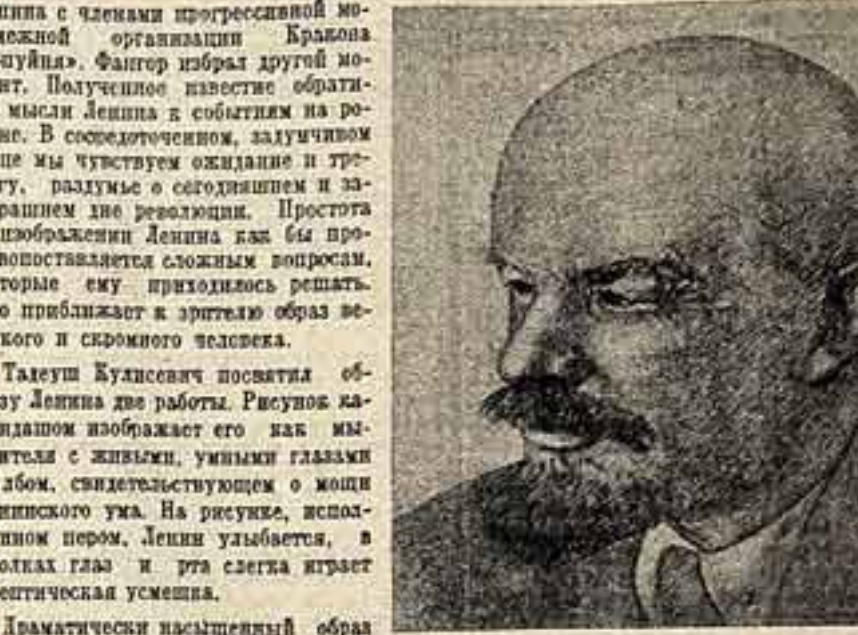
В. И. ЛЕНИН. Рис. Тадеуша КУЛИСЕНЧА. Польша.

Великий Ленин на минуту не забывал о нуждах трудящихся бакинского Азербайджана и всего Закавказья.