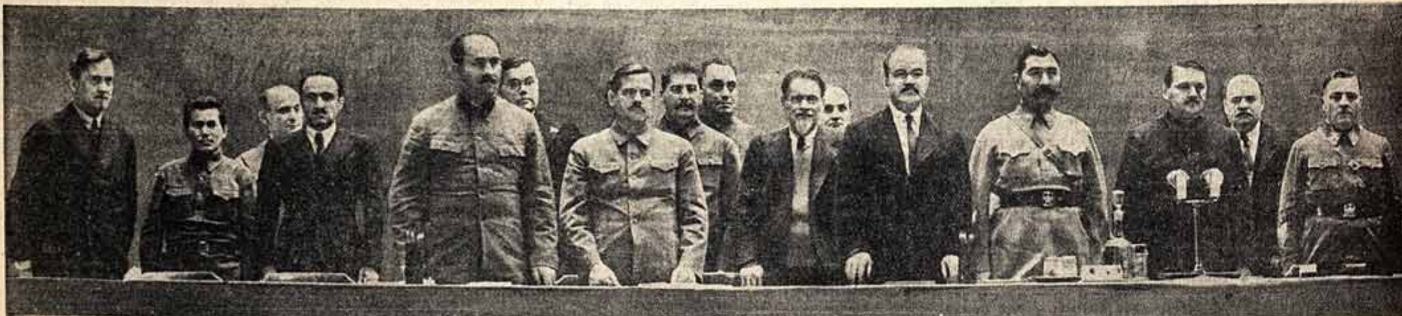
21 января в Государственном академическом Ордена Ленина Большом театре Союза ССР состоялось траурное заседание, посвященное 15-й годовщине со дня смерти Владимира Ильича Ленина. На снимке: в президиуме траурного заседания (слева направо) товарищи БУЛГАНИН, ЕЖОВ, БЕРИЯ, МИКОЯН, КАГАНОВИЧ, ШЕРБАКОВ, АНДРЕЕВ, СТАЛИН, ДИМИТРОВ, КАЛИНИН, ШКИРЯТОВ, МОЛОТОВ, БУДЕННЫЙ, ЖДАНОВ, БАДАЕВ и ВОРОШИЛОВ.