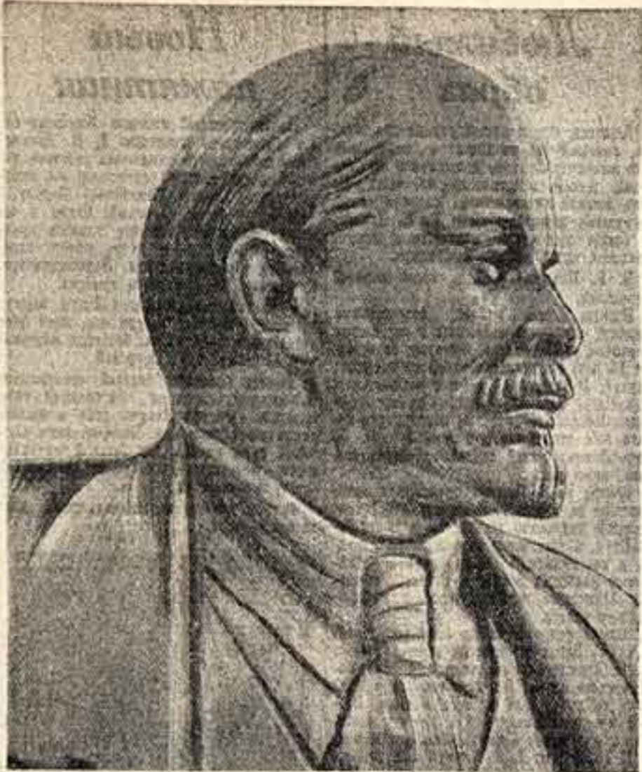
«Ленин». Работа скульптора В. Б. Пинчука