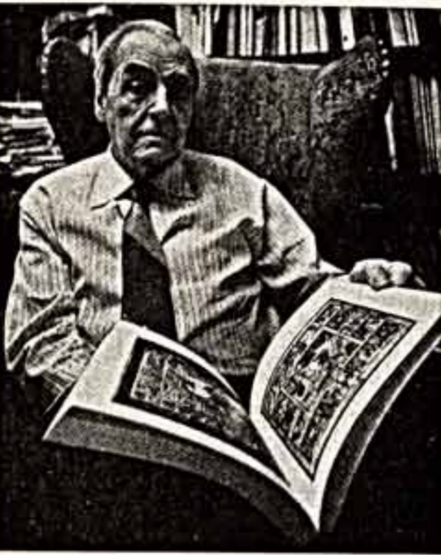
● Г. Вагнер.