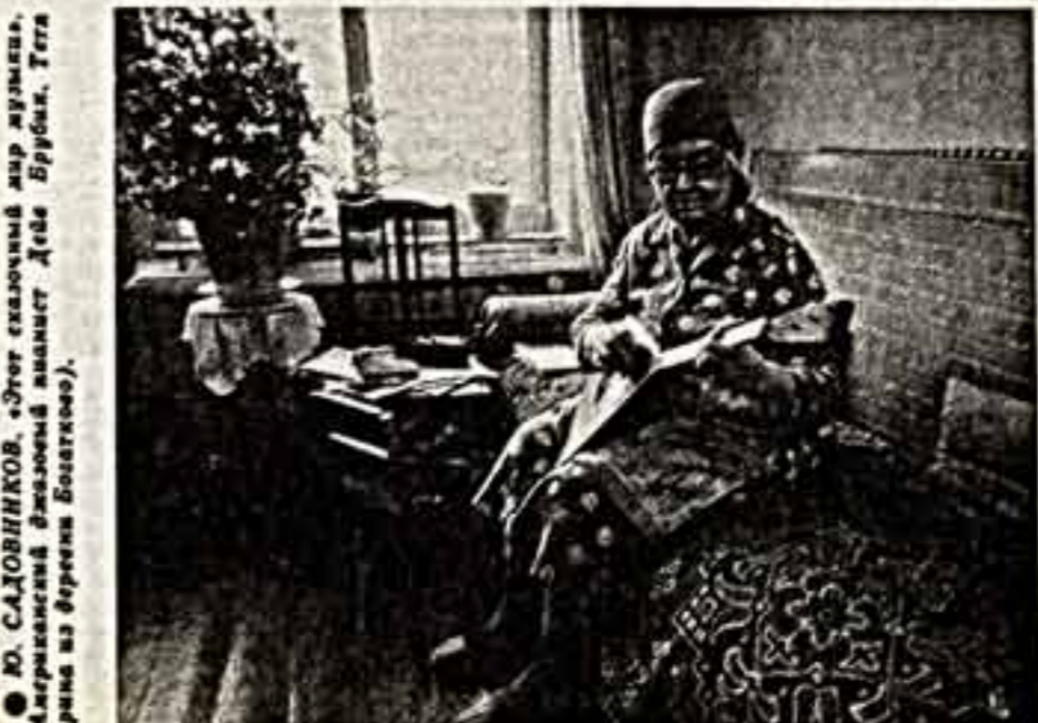
Ю. САЛОВИКОВ. Этот сказочный мир искусства (Американский фольклорный ансамбль Дев Бургинк. Тртт Арлеин на берегу Болотского).