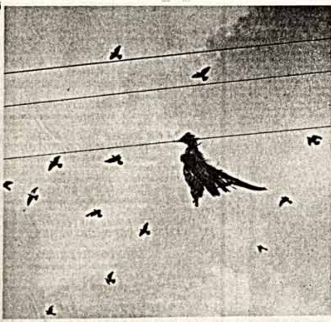
Мы не можем ждать милости от природы?