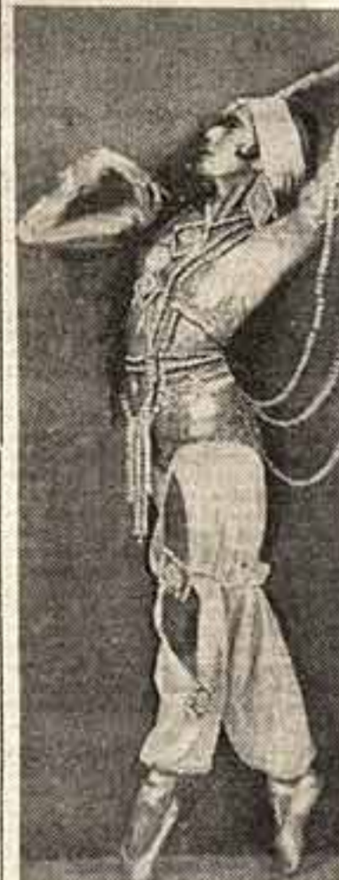
Ленинградский театр Оперы и Балета «Бахчисарайский фонтан»