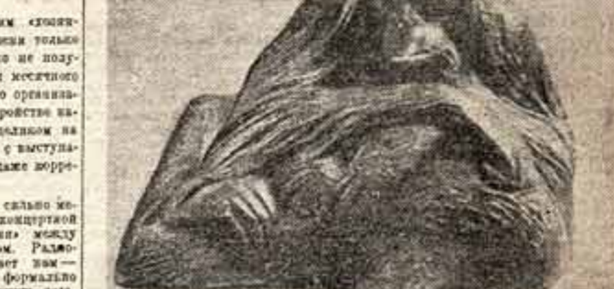
Выставка «Скульптура в дереве». В. А. Загладин «Орангутанг» (голова)

Каждый концерт должен быть не только концертным, но и эстрадным. Мы считаем, что это количество концертов должно быть увеличено, чтобы мы могли бы проводить не только одну треть нашей программы, но и другую треть. Мы считаем, что это количество концертов должно быть увеличено, чтобы мы могли бы проводить не только одну треть нашей программы, но и другую треть. Мы считаем, что это количество концертов должно быть увеличено, чтобы мы могли бы проводить не только одну треть нашей программы, но и другую треть.