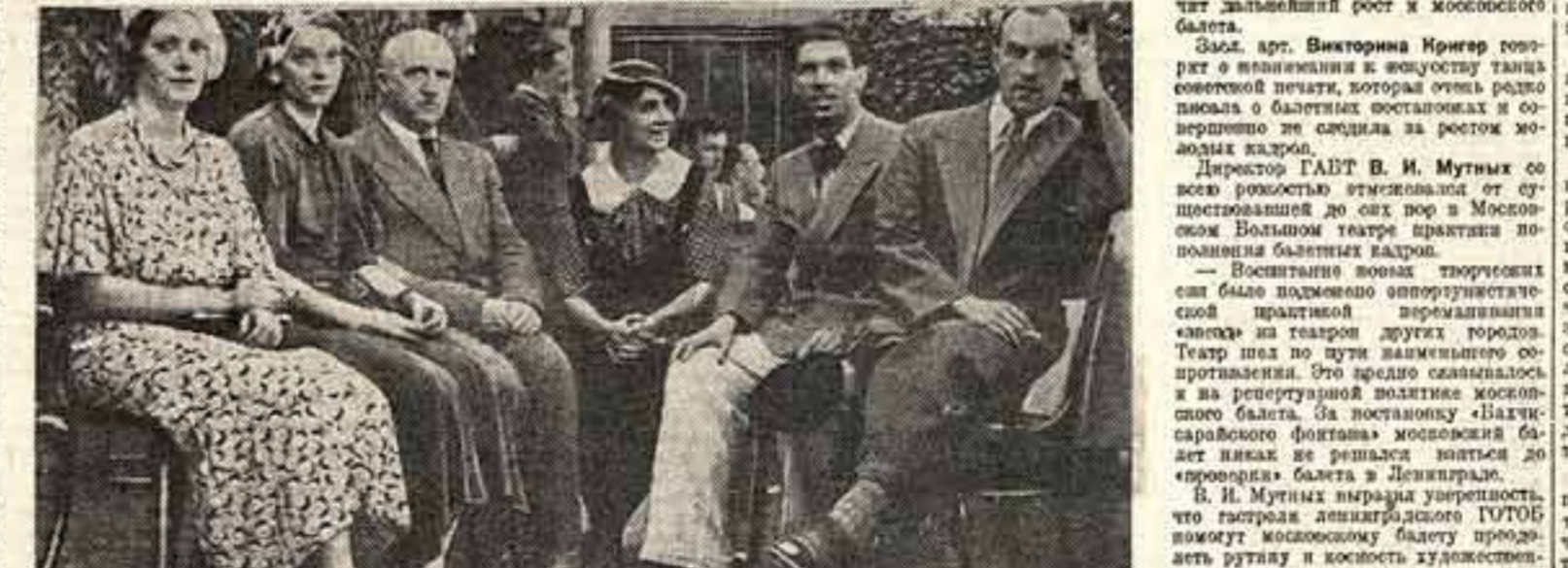
Группа участников совещания о путях Ленинградского балета, созванного «Советским искусством»