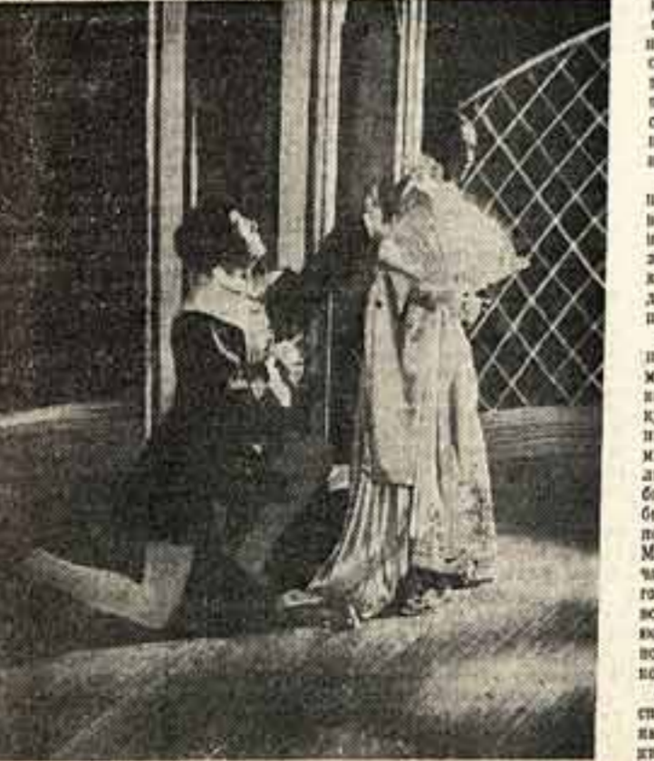
Оперная студия Московской консерватории. Слева Фигаро, Фигаро — Бокко, Сусяна — Дорина