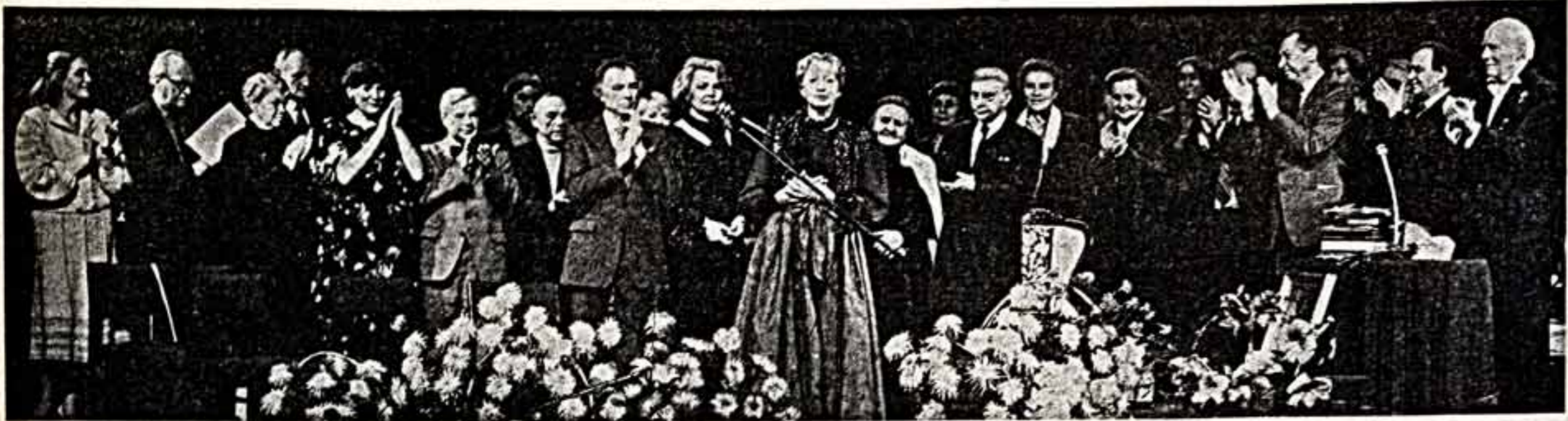
Чествование юбиляра. (После спектакля — премьеры «Серебряной свадьбы» А. Машарина во МХАТе состоялось торжественное чествование Героя Социалистического Труда народной артистки СССР Александры Носовичевой Степановой. Ее поздравляли представители театральной общественности столицы, друзья, коллеги по ее родному театру).