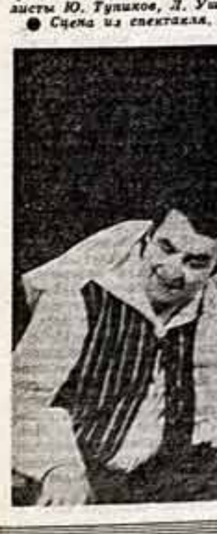
Сцена из спектакля.