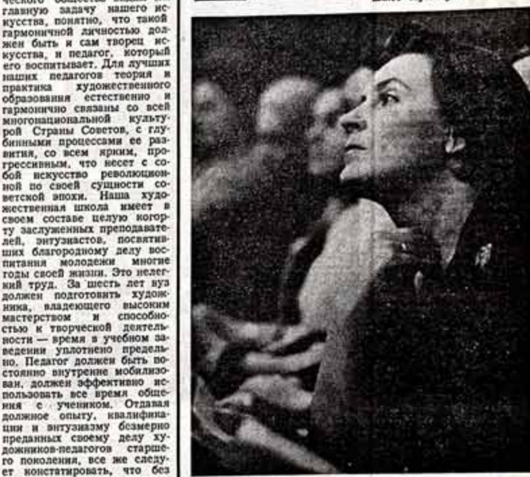
«Двенадцатая ночь» — на языке балета

Озорной, замечательный шекспировский смех пронизывает хореографическую комедию «Двенадцатая ночь», премьеру которой показал Ленинградский театр современного балета.