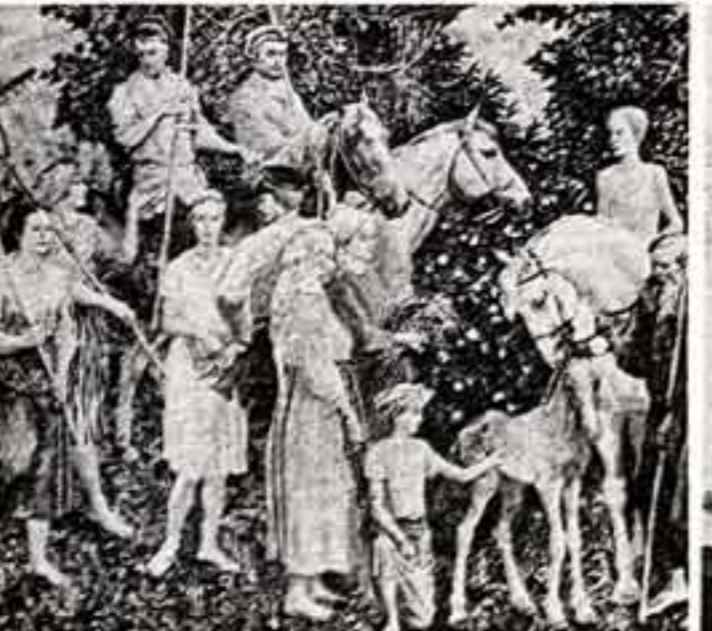
В Москве и Ленинграде зрителям знакома с изобразительными дипломами работ выпускников, окончивших в 1984 году наш старейший художественный институт — Ленинградский институт живописи, скульптуры и архитектуры им. И. Е. Репина и Московский государственный художественный институт им. В. И. Сурикова. Своими размышлениями в