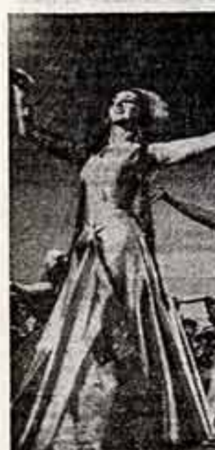
Государственный заслуженный ансамбль народной песни и танца Абахи подала новую программу в столице и селах автономной республики...