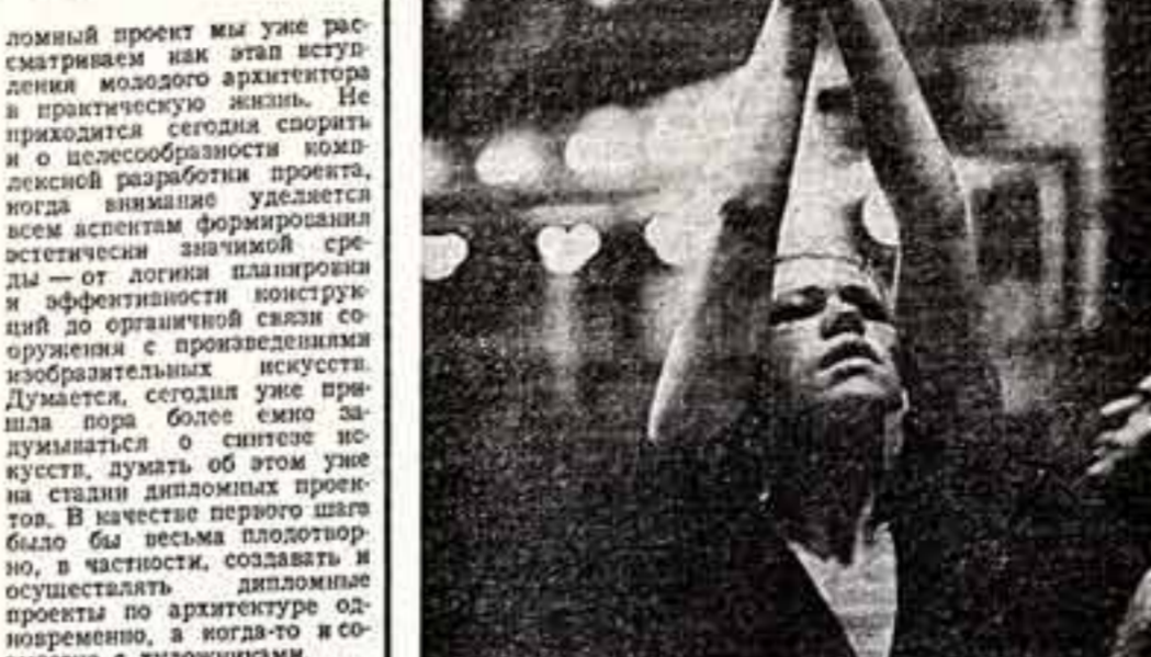
А. ГАРАНИН. «Рекетица». (Народная артистка РСФСР М. Дроздова). «Слушает музыку».

Итак, проблем, нерешенных вопросов, над которыми стоит поразмыслить, много. Но ведь каждый смотрит работ выпускников наших художественных вузов — это и отчет перед зрителем, и подведение итогов. Залета — во всемерном укреплении и творческом развитии принципов советского художественного образования.