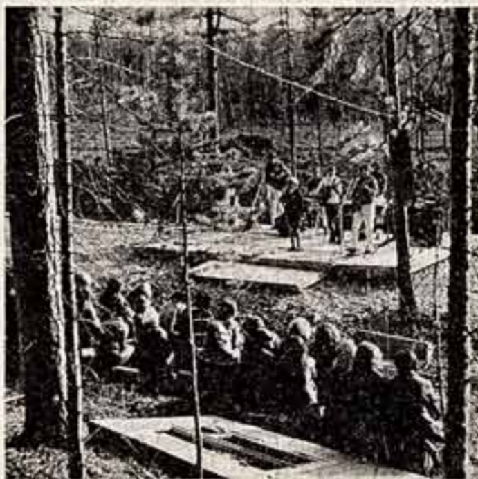
А. ПЯНОВ. «Концерт на трассе БАМ». (Выступает ансамбль дома культуры «Юность» города Тынды). Ю. КЕЛЬДИН. «Большой хлеб». (Хозяйка Шелехова — комбайнер совхоза имени Сейфуллы Целиноградской области, где завершается уборка урожая).

Т. ДЖУРДЕКОВ, заведующий сектором отдела культуры ЦК Компартии Туркменистана.