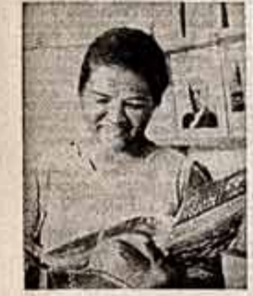
У стола с советскими книжками.

Скульптура — говорит ее автор — как бы символизирует смысл Союзения в Хельсинки, направленного на укрепление дружбы и мирного сотрудничества между народами.