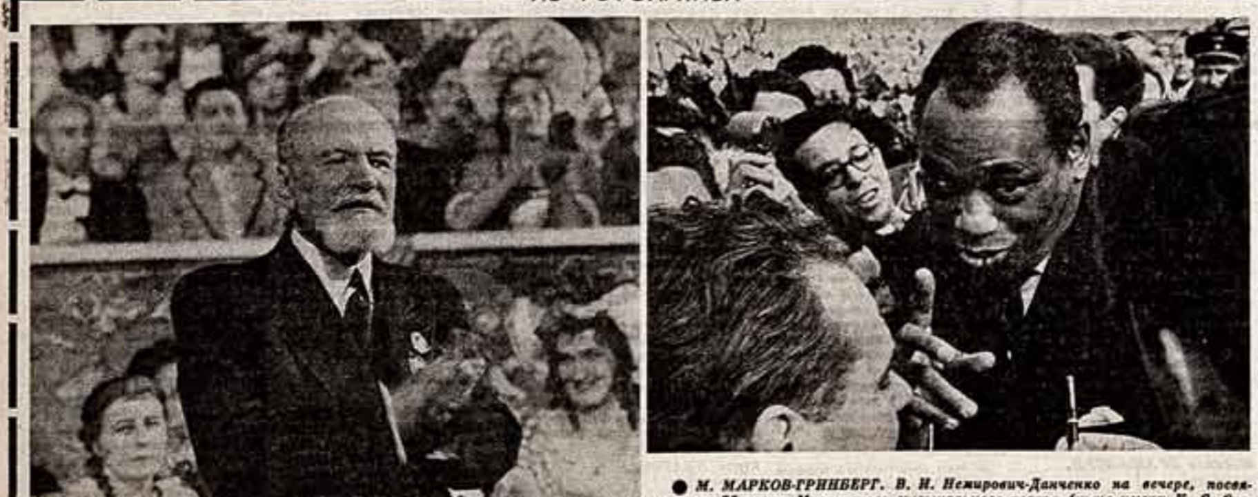
М. МАРКОВ-ГРИНБЕРГ. В. Н. Невзоров-Данченко на вечере, посвященном 20-летию Московского музыкального театра (ныне имени К. С. Станиславского) и В. Н. Невзоров-Данченко). А. СТОЛЖАРЕНКО. Путь Робин в Москве.