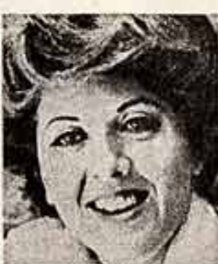
Наша собеседница — известная в Советском Союзе и в других странах греческая певица Иованна.

Скульптура — говорит ее автор — как бы символизирует смысл Союзения в Хельсинки, направленного на укрепление дружбы и мирного сотрудничества между народами.