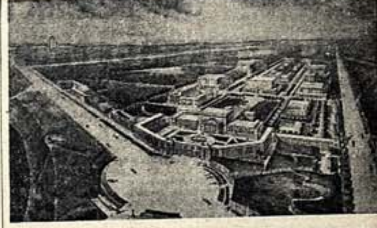
Большой Московский. Общий вид здания после расширения и реконструкции. (Вариант проекта).

Получается, что проект театра в Муроме — это проект, который не учитывает особенностей местного населения.