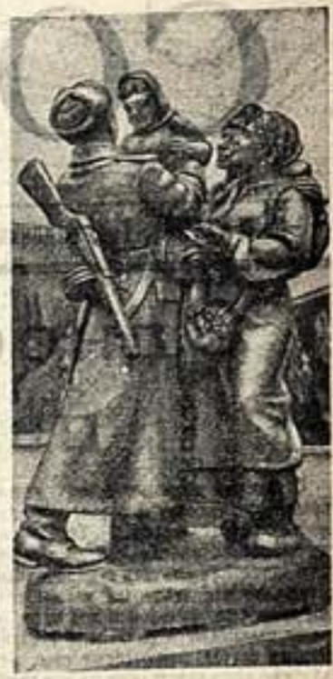
Выставка живописи, графики, скульптуры и прикладного искусства...