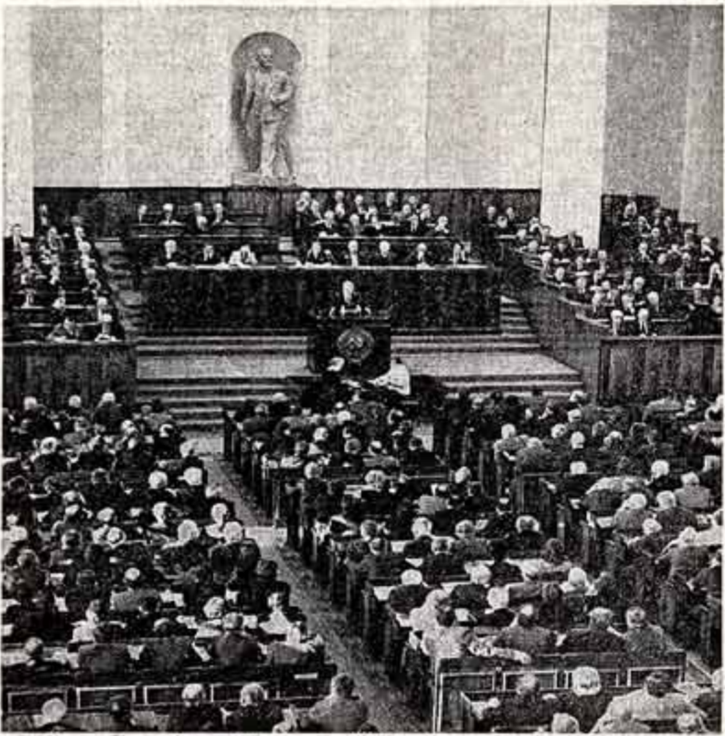
Москва, Кремль, 3 декабря 1982 года. Объединенный пленум правлений творческих союзов и организаций СССР и РСФСР.