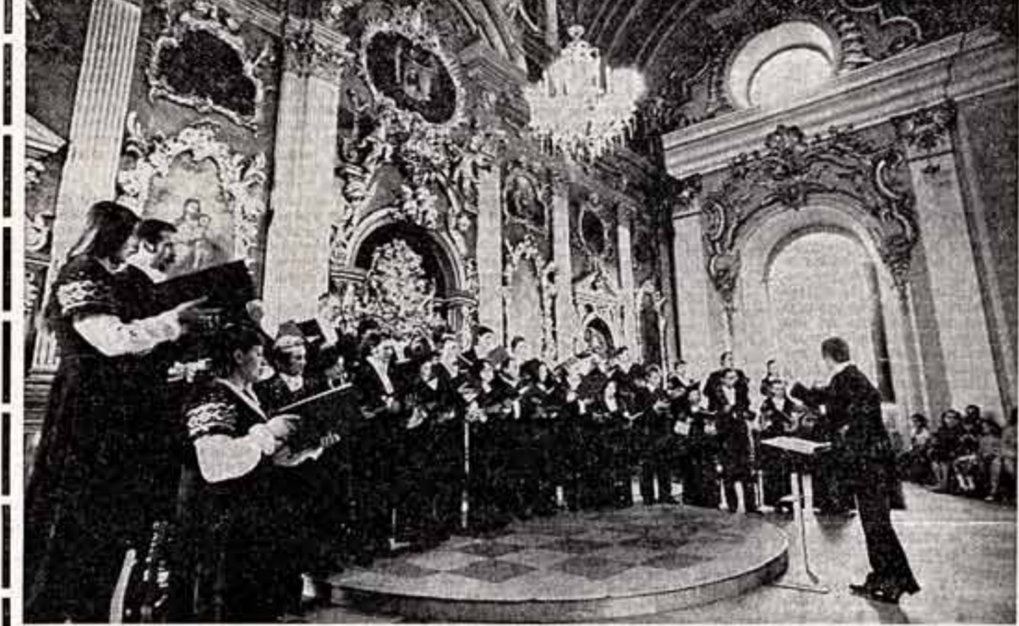
Киевляне — большие любители и ценители музыки. Сегодня музыкальная жизнь столицы Украины проходит не только на традиционных площадках Государственной филармонии и Республиканского дома каменной и органоидной музыки...