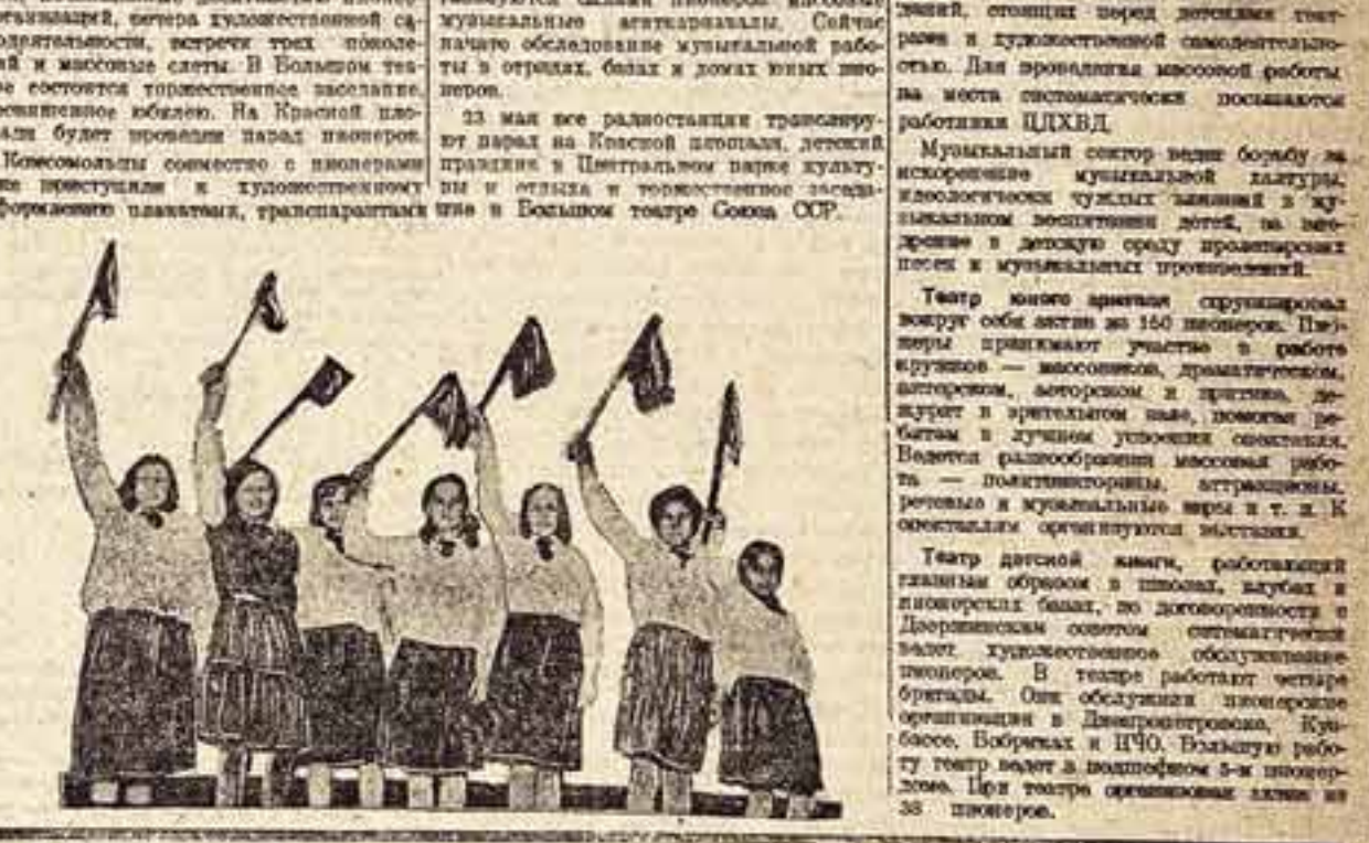
Дети с флагами и лозунгами

В течение месяца проводится передвижной просмотр фильмов. Это для детей смотром достояния киностудии, в частности, в отношении буржуазных художественных организаций, в частности, в отношении Центрального комитета партии.