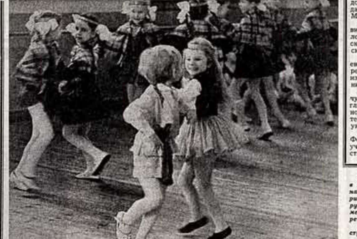
Большой популярностью в Ленинграде пользуется балетная студия Дома культуры рижского завода «ВЭФ». Под руководством опытных балетмейстеров активно ведется работа по развитию детского искусства хореографии.

В музыкальном путешествии по союзным республикам пригласила слушателей филармония имени Д. Д. Шостаковича, посвятившая цикл концертов 60-летию образования СССР.