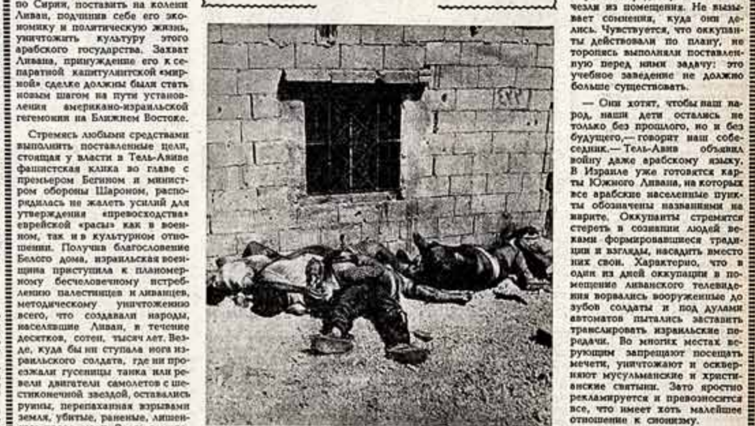
Жертвы израильских бандитов.