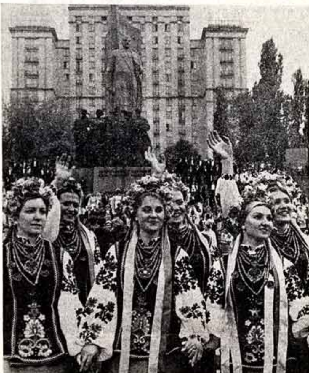
ПРАЗДНИЧНОЕ НАСТРОЕНИЕ.

Мы, советские люди, как руководящее к действию восприняли слова Леонида Ильича Брежнева, сказанные им в докладе «О проекте Конституции Союза Советских Социалистических Республик»: «Нужно, чтобы каждый советский человек ясно сознавал, что главная гарантия его прав и свобод — это мощь и процветание Родины. А для этого каждый гражданин должен чувствовать свою ответственность перед обществом, добросовестно выполнять свой долг перед государством, перед народом».