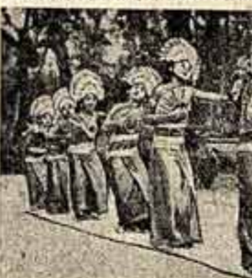
Танец девушек с острова Бали.