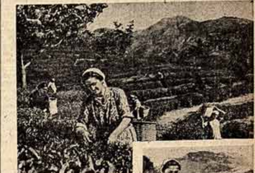
На снимке: сбор чайного листа в колхозе им. Сталина села Чамусбаги Батумского района.