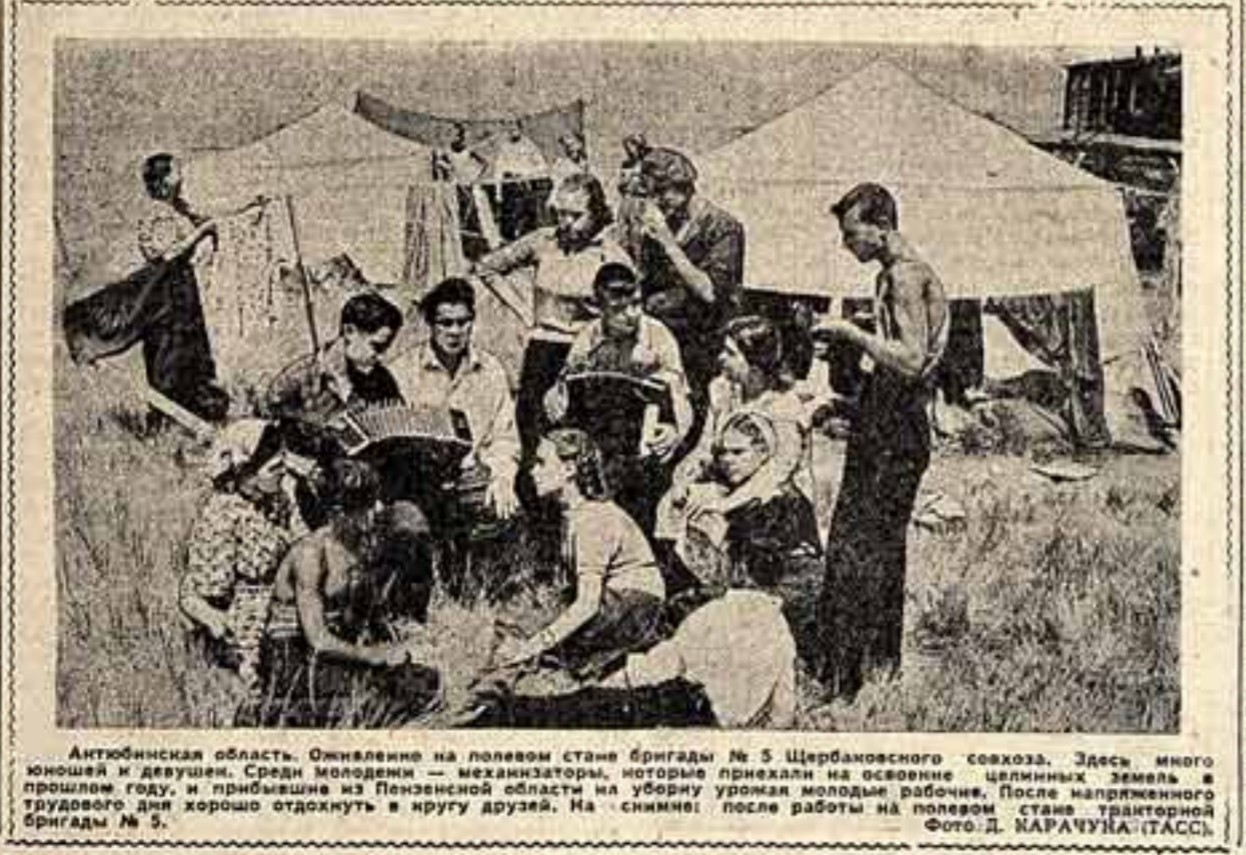
Антюбинская область. Оживленно на полевом стане бригады № 5 Щербановского совхоза. Здесь много молодежи и девушек. Среди молодежи — механизаторы, которые приехали на освоение целинных земель в прошлом году, и прибывшие из Пензенской области на уборку урожая молодые рабочие. После напряженного трудового дня хорошо отдохнуть в кругу друзей. На снимке: после работы на полевом стане тракторной бригады № 5.

Вот в бригаде номер шесть Лукьяненко Виктор есть, Ночью Вити наш гуляет, Дрем под стогом отыкает. До рассвета у лавета Трактор с полдня простоят