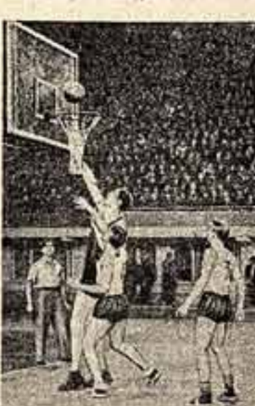
Один из моментов игры между баскетболистами Латвии и Казахстана.