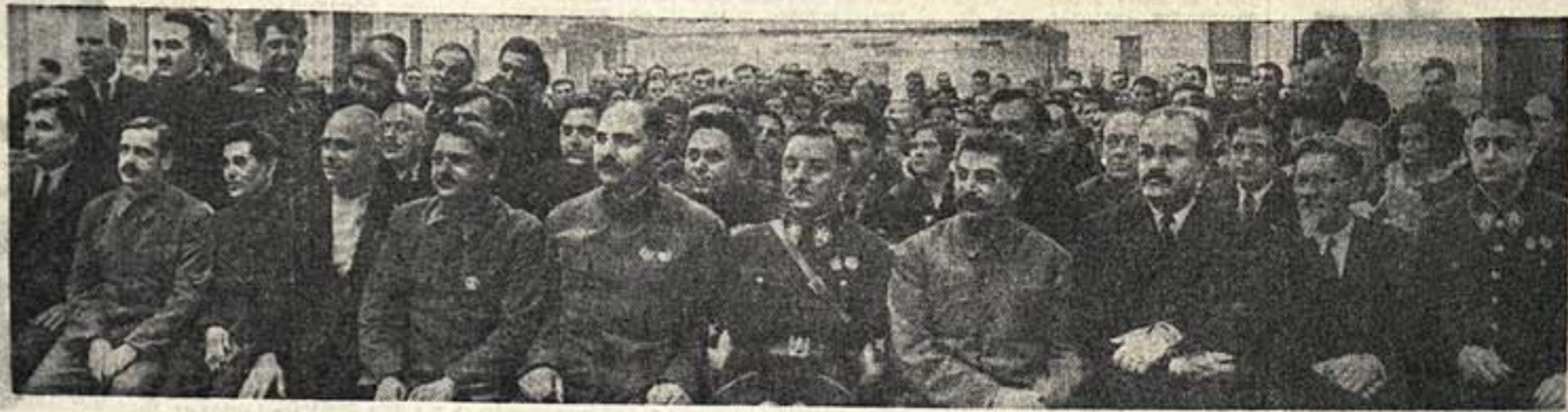
Чрезвычайный VIII Всесоюзный Съезд Советов. На снимке: руководители партии и правительства во главе с товарищем Сталиным в группе делегатов Московской области