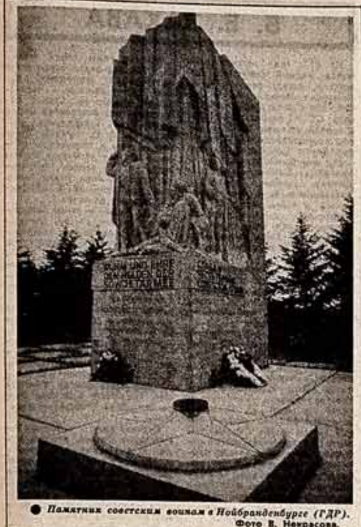
Памятник советским воинам в Нойбранденбурге (ГДР).