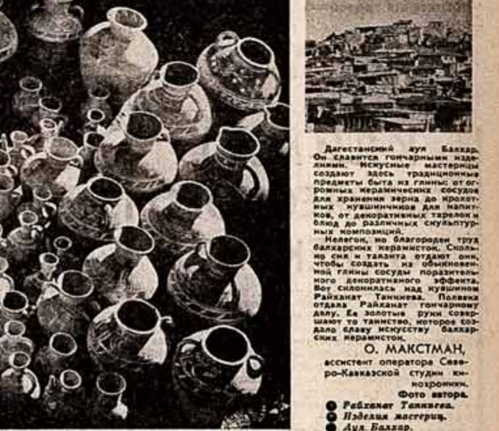
Декоративный кувалд Бахтар. Он славится горчарными изделиями. Искусные мастера создают здесь традиционные предметы быта из глины: от горчарных керамических сосудов для хранения зерна до крошечных кушачников. Декоративные тарелки и блюда, от декоративных тарелок и блюд до различных скульптурных композиций. Недавно, по благородию труд бахтарских керамистов. Скопировали и талант отдают они, чтобы создать из обыкновенной глины сосуды поразительной красоты. Работают гонимому аду. За последние дни совершают то таинство, которое создает славу искусства бахтарских керамистов.