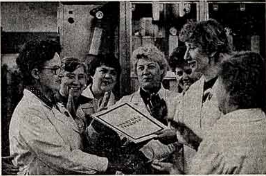
Вчера в Центральном доме кино состоялось торжественное собрание кинематографистов столицы, посвященное вручению ордена «Знак Почета» Московской киноиндустриальной фабрики.

Г. АЛИЕВ, начальник буровой работ «Нефтяные Камни», народный контролер.