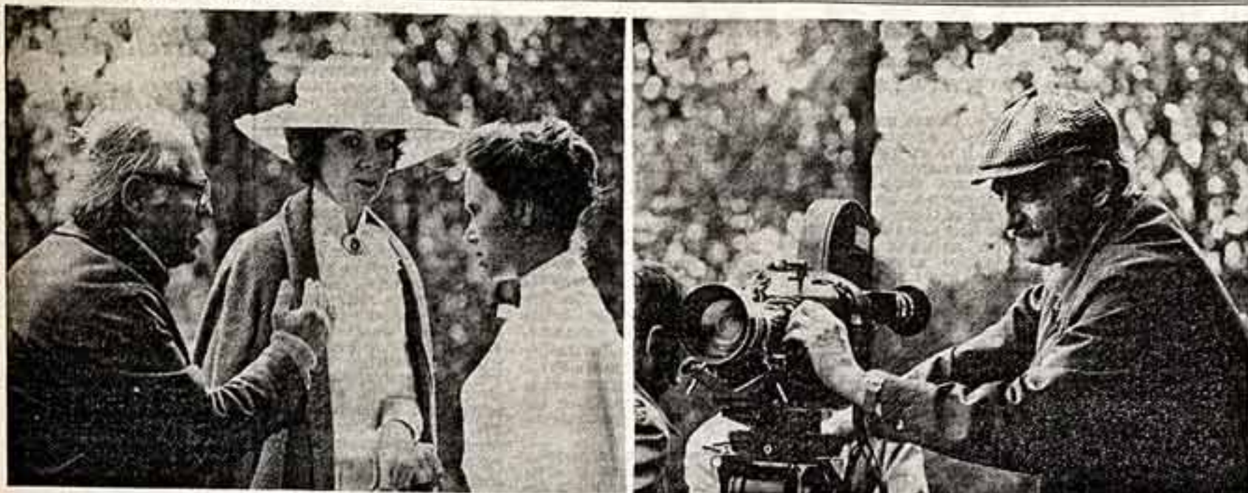
В теоретическом объединении «Экран» идет работа над новым двухсерийным телевизионным фильмом «Дети солдата»...