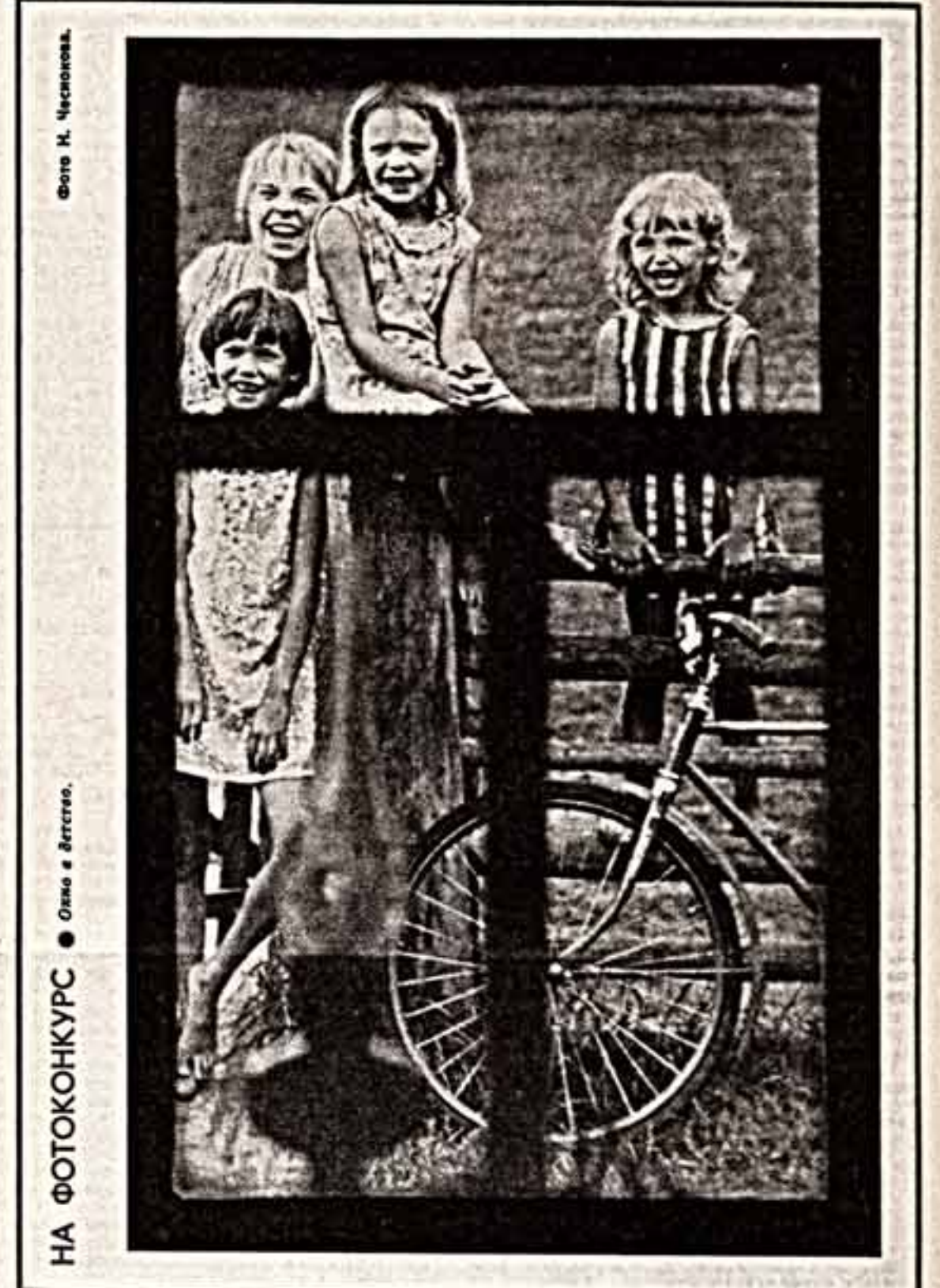
Ольга и детство.