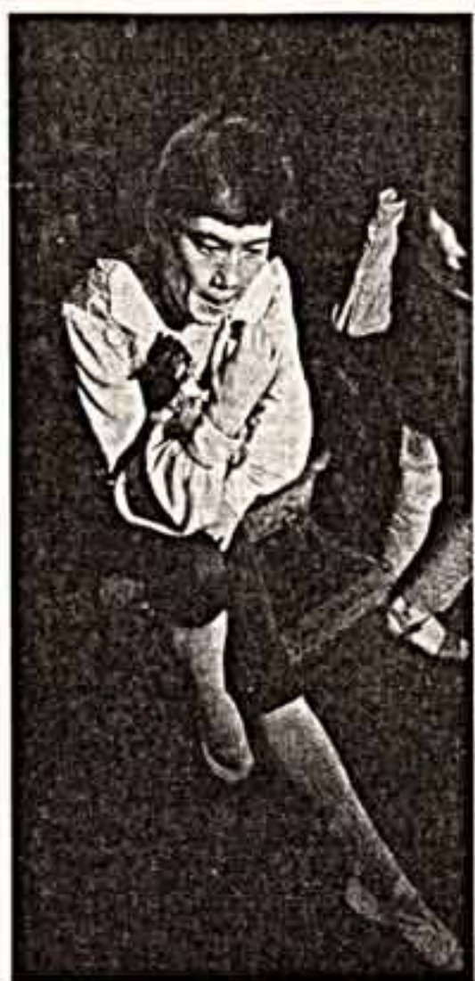
За кулисами. На сцене. В зале...

На заседании Политбюро были также обсуждены нагорные и некоторые другие вопросы партийной и общественной жизни.