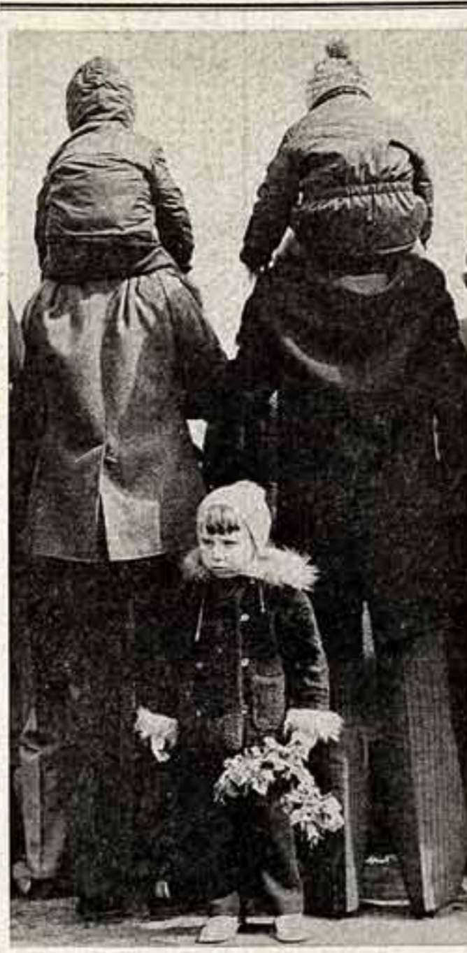
ФОТОКОНКУРС В. НИКОЛИН. «Не поезда»