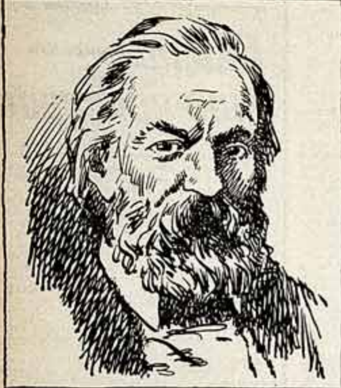
«Я люблю Москву, люблю ее за ее русский характер...» А. ГЕРЦЕН.