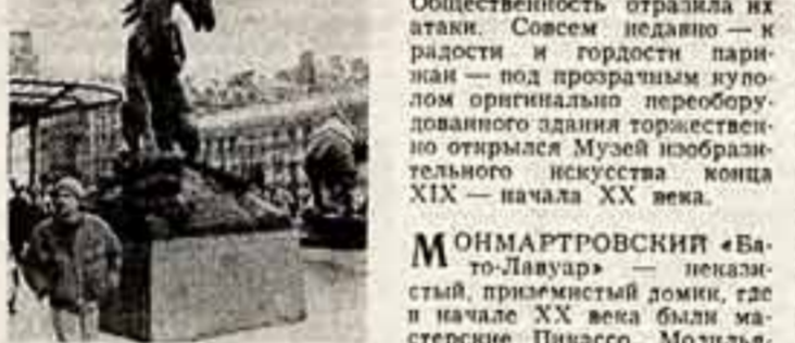
У входа в музей Орсе.