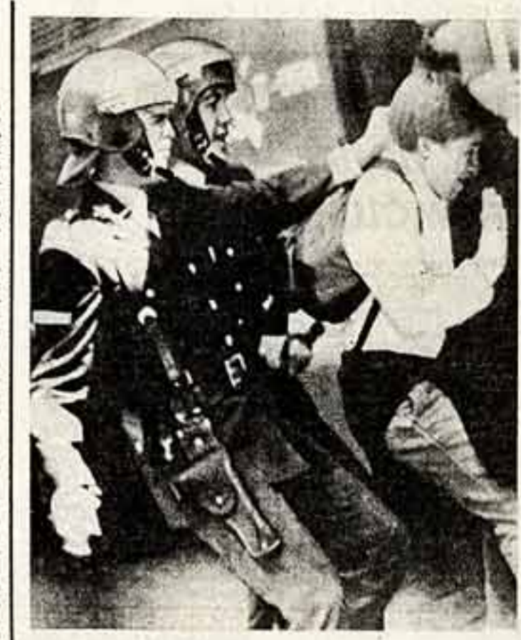
Дубинки, водометы и слезоточивый газ использовала чадская полиция для разгона массовой демонстрации протеста в Салгайо против антиарабской политики властей. Как сообщает агентство Рейтер, участники захватили автобус, организованный по призыву Национального ру-