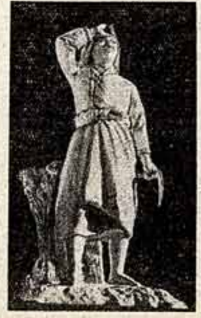
Те Го Бон. «Радость богатого урона».