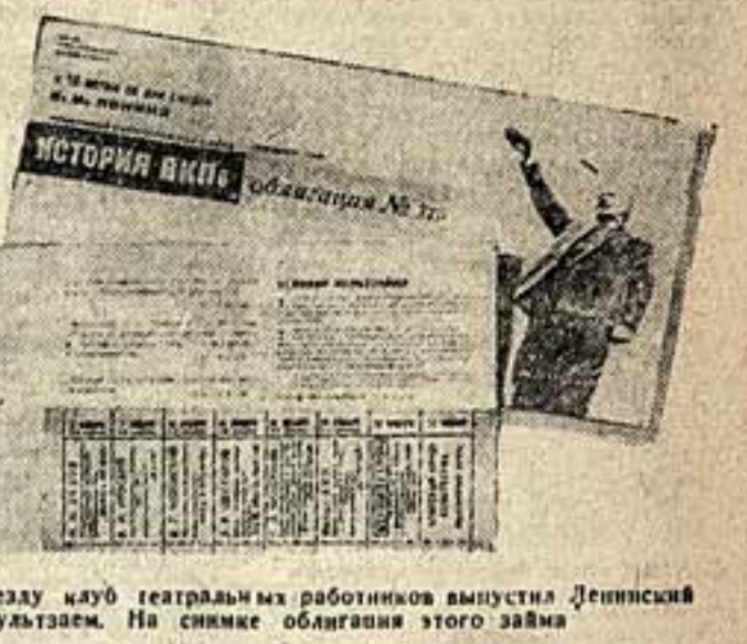
К XVII партсъезду клуб театральными работниками выпустил Ленинский культзем. На снимке обложка этого займа

Теперь слесю законченных сочинений я работаю над симфоническим произведением, с которым и приступаю к XVII партийному съезду. Истекшее трехлетие являлось для меня чрезвычайно плодотворным не только в смысле перестройки моего мировоззрения, но и в смысле количества написанной музыки.