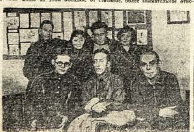
Художественная агитбригада Гос. Нового театра, выехавшая в МТС Саложского района Московской области

Одновременно я работаю и над темой политико-исторической картины «Политическая социальная».