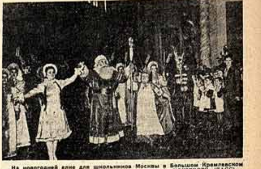
На новогодней елке для школьников Москвы в Большом Кремлевском дворце.

ДЕСЯТИ ТЫСЯЧ МОСКВИЧЕЙ ПРИОБРЕЛИ ЛИТЕРАТУРУ в книжных магазинах и на базарах 30 и 31 декабря — в дни Всероссийского праздника книги. На снимке: в мануфактурной торговле в Москве.