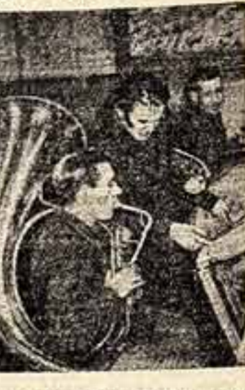
Сынная область. Дав годы назад в Москве имени Чапаева Ульяновского района был построен клуб. Сейчас это любимое место отдыха молодежи. Здесь открыта библиотека, созданы кружки художественной самодеятельности, два оркестра — духовой и духовой.

Драматург подошел к нами в своем творческом плане. Он хочет написать новый сценарий, но оставляет мысль о пьесе. Их темы — жизнь современности, их герои — советские люди, А. ТОВЧИНСКИЙ.