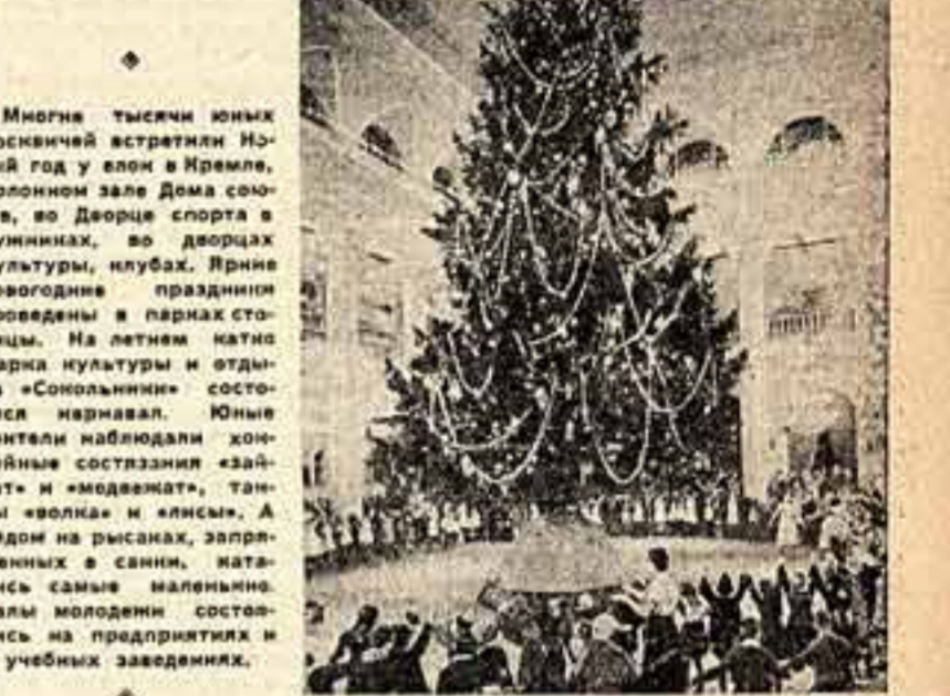
29 декабря в Колонном зале Дома союзов состоялось открытие новогодней елки. На снимке: танцы детей у елки.