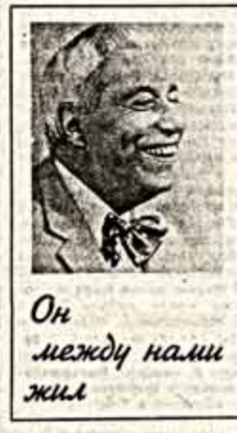
Он между нами жил