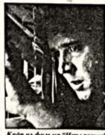
Кадр из фильма "Угры разума"