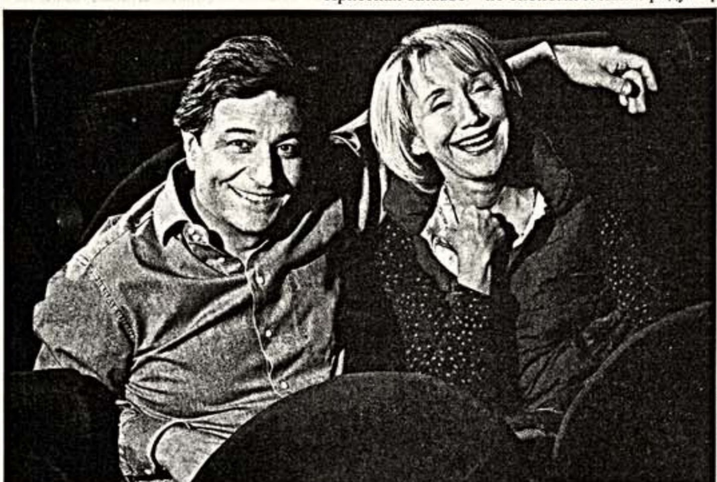
К.Клавье и М.-А.Шазель: вместе на сцене одиннадцать лет спустя

Кристиан Клавье - не экономический продукт рынка