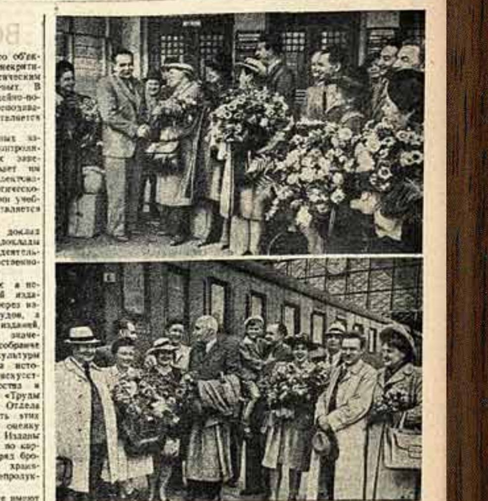
Приезд в Москву гастрольного театра белорусской республики. Вверху — встреча коллектива белорусского Государственного драматического театра имени Янки Купалы на Белорусском вокзале. Внизу — встреча коллектива Киевского русского театра имени Леси Украинки на Киевском вокзале.