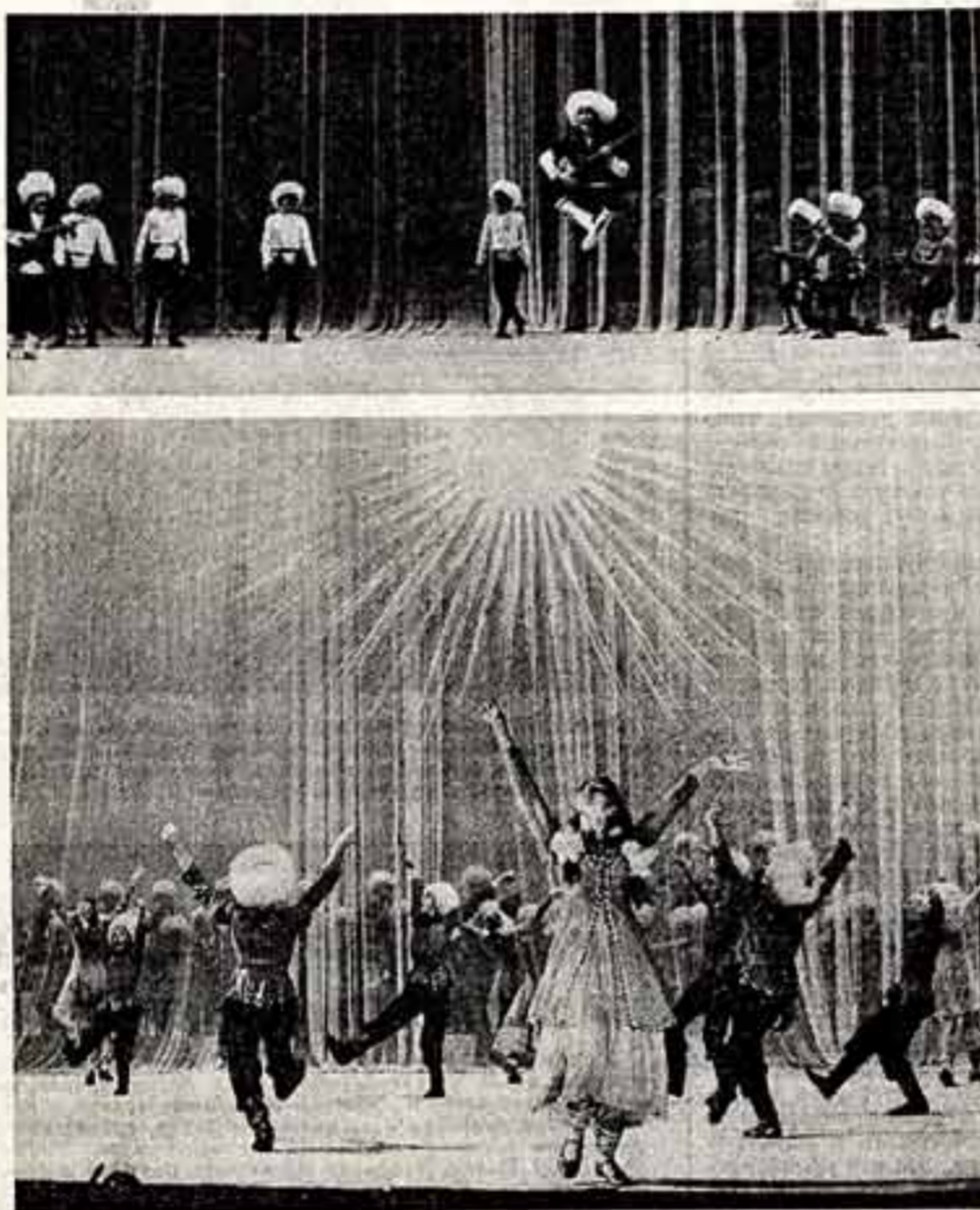
На концерте в Большом театре СССР, посвященном 100-летию дружбы и искусства Туркменской ССР в РСФСР.