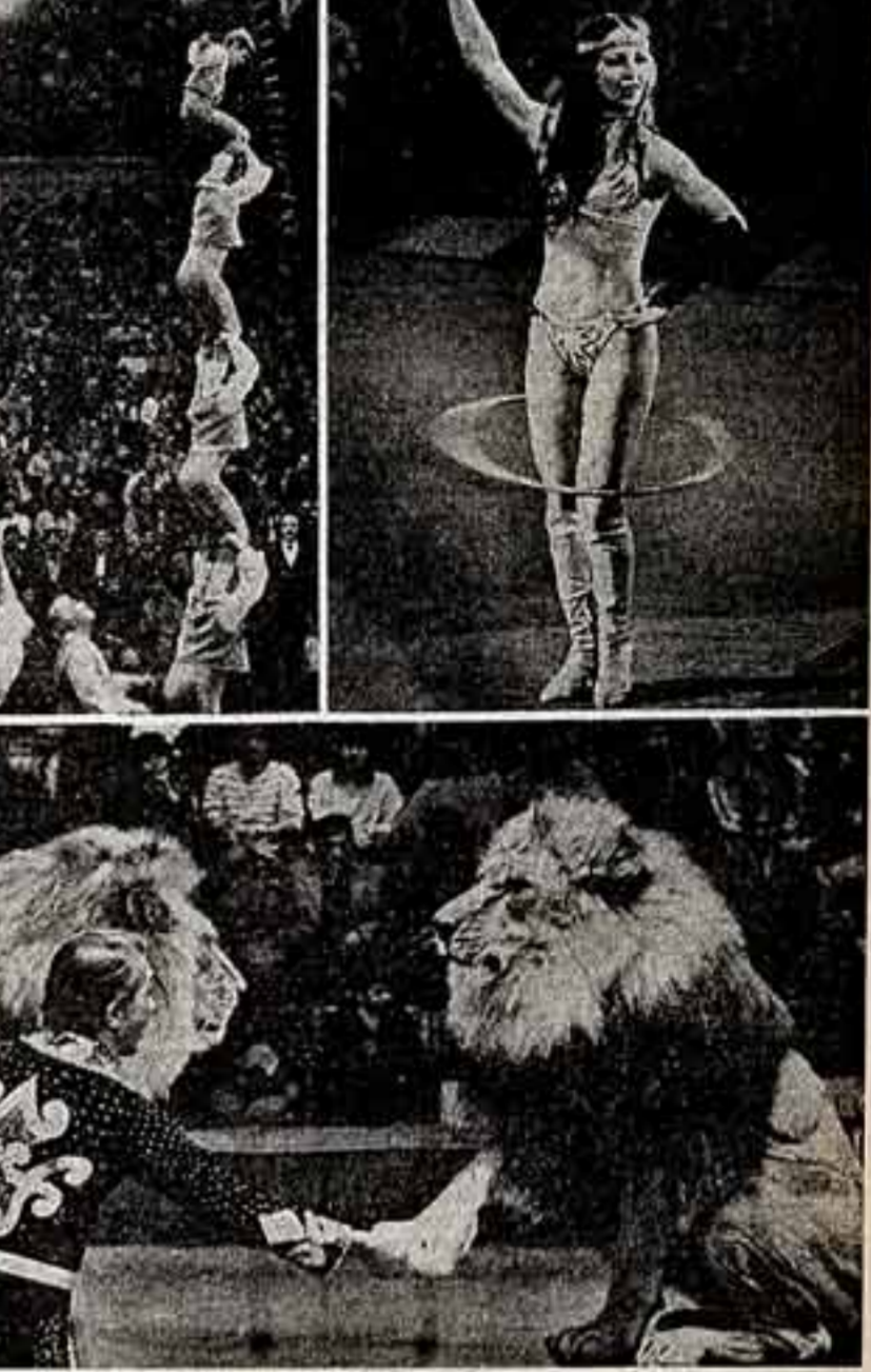
В Московском цирке на Цветном бульваре с успехом идет представление «София — Москва» с участием артистов цирка Болларис.

Но мастерять надо — дело непростое. Сузился круг сельских умельцев, мастеров, хотя круг современных профессий в сельскохозяйственном производстве за тот же период неизмеримо расширился. Изначалась один советский директор, что не может заселить три новеньких двухквартирных дома только потому, что шельма в их структуре печники. Дефицитная профессия! Дилем с огнем не найдешь. Хвалится один старший печник, что отношение к нему, как к министру: поутру около дома две, а то и три легковушки стоят, наперед приглашают его и обслуживают, и хозяйка, которым надо сложить печь. Или бы, или печь «адушкополюшко» ждала. У них сверху дождик програвается каждой кирпичи-