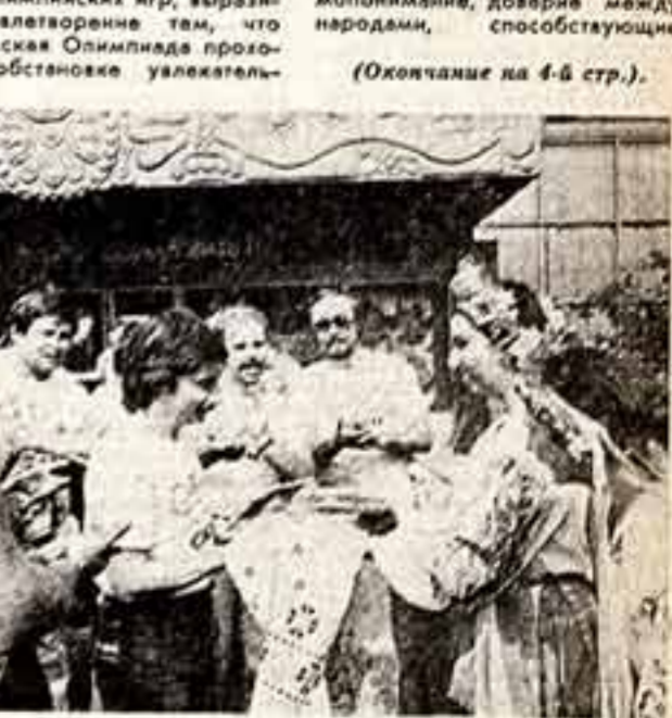
В интернациональном клубе «Росеник» олимпийского города Киев состоялась теплая встреча украинской молодежи с иностранными гостями Олимпиады. Хлеб-соль чехословацким друзьям от студентов Киевского института народного хозяйства.