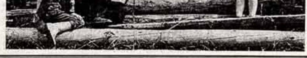
ТВ: местное время. Опыт и проблемы