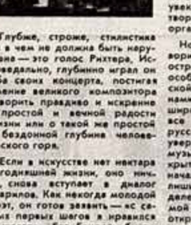
Глубже, строже, стилистичнее в чем не должна быть нарушена — это голос Рихтера. Исповедально, глубоко играл он обо своих концертах, поставив у себя великого композитора, говоря правду и искренне о простой и вечной радости жизни или о такой же простой и бездонной глубине человеческого горла.

В трактовке Генделя мы наблюдали увлекательный диалог большого мастера и начинающего артиста. Гаврилов играл современно, ярко, ораторски. Классик — это вечный современник, Гаврилов как бы подхватывает мысль Генриха Нейгауза.