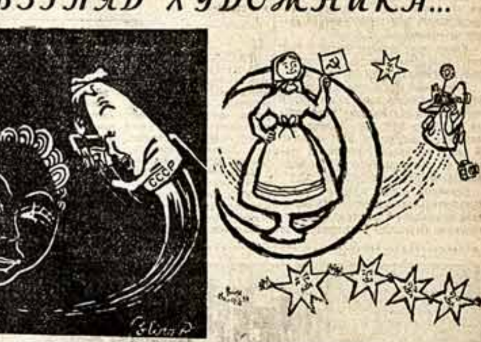
Первый фоторепортер снимает Луну. Рисунок из альбомной галатеи «Зери и популит».