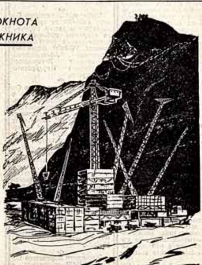
ИЗ БЛОКНОТА ХУДОЖНИКА