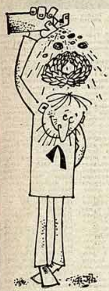
Без слов. Рис. М. Рукотс.