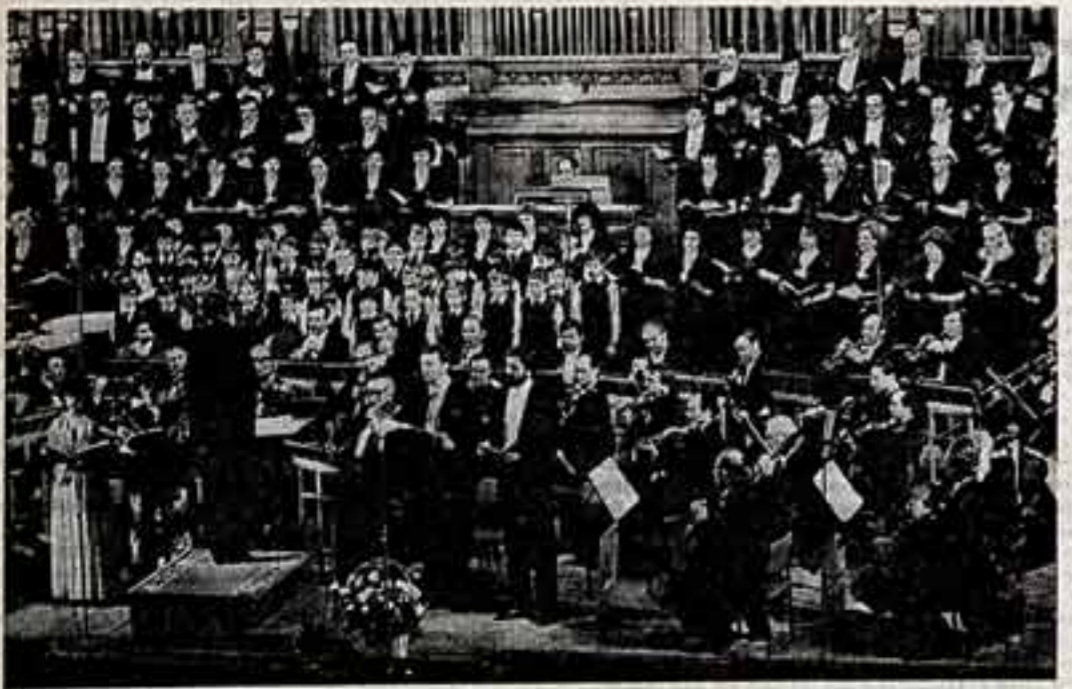
Во время концерта.