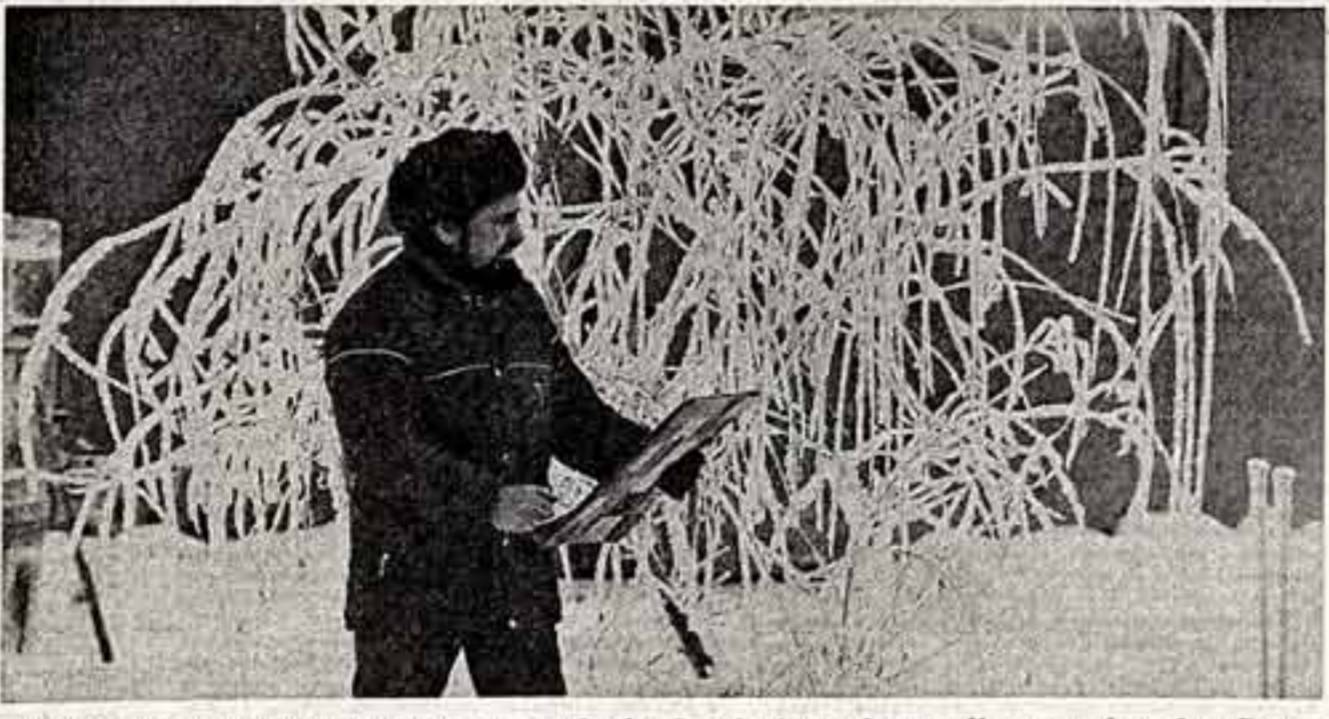
В окружающей природе черпают жотимы росписей изделий из фарфора художники Минского ордена «Знак Почета» фарфорового завода. Природа Белоруссии дарит их волшебные узоры во все времена года. ● Работа с натурой — необходимоя условие для совершенствования мастерства — так считает художник завода, проработавший здесь более двадцати лет, Л. Войдилов.