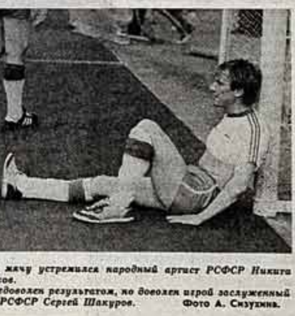
К жучу устремился народный артист РСФСР Никита Михалков.