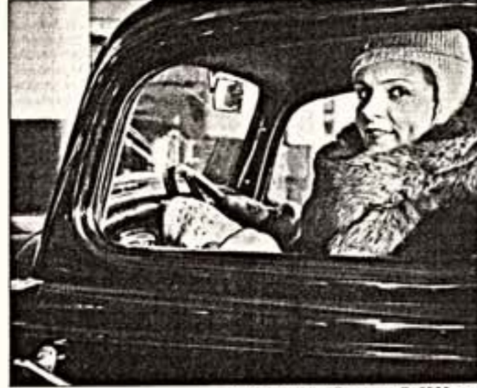
Э.Эйзенштейн. "В машине". 1930-31 гг.