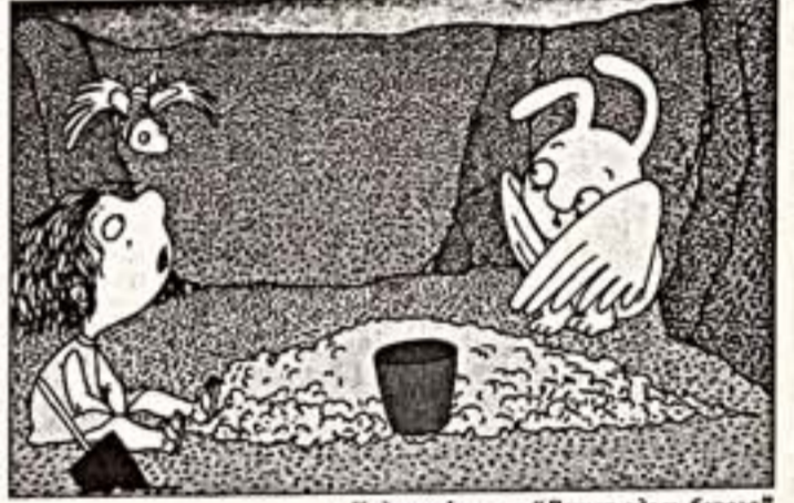
Кадр из фильма "Ветер вдоль берега"

— На премьеры вы выглядели несколько озабоченным... — Серьезно? — Именно. До сих пор не пришли в себя от неожиданного-нежданного свалившегося успеха?