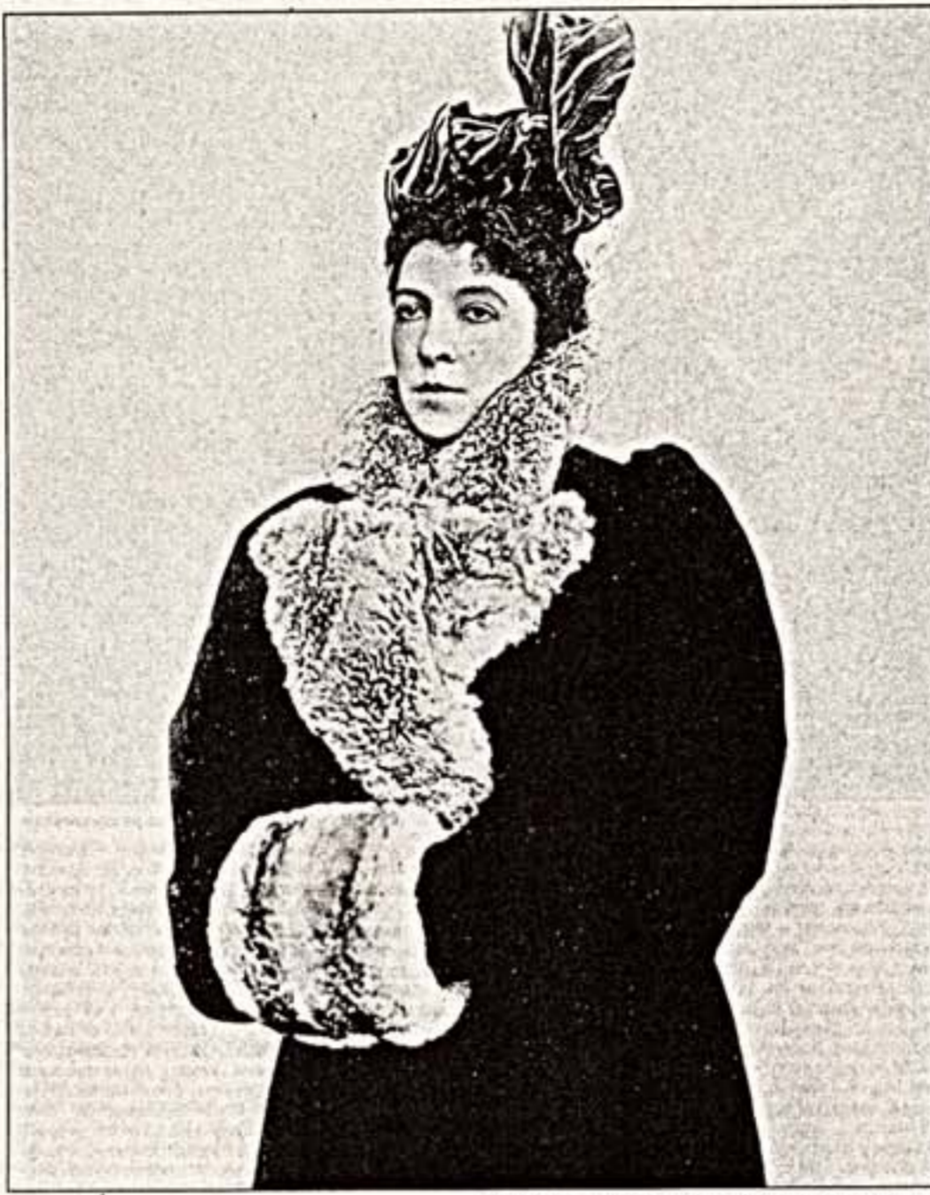
М.Савина. На гастролях в Берлине и Праге. 1899 г.

Савина между тем уже ощутила оборотную сторону успеха. Дирекция для парадных сборов занимала любимую публикой артистку в то, через два года после дебюта в Петербурге она уже не могла больше выдержать невероятных нагрузок, и однажды она ушла в обморок прямо во время действия.