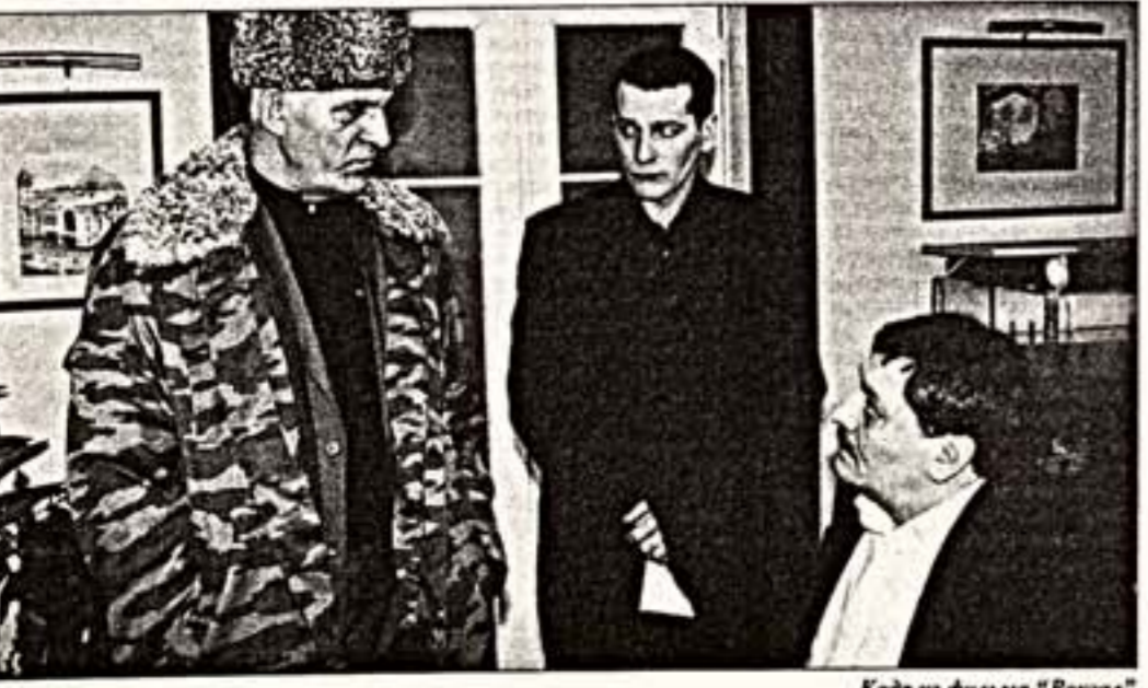
Кадр из фильма "Восход"