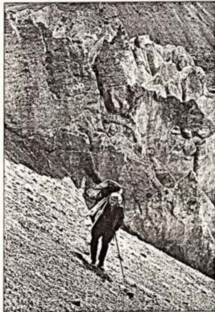
В.Гимпелрейтер. "Восхождение". 1981 г.

Известно, что правильное использование цвета в художественной фотографии — дело непростое. Даже везучие итальянские режиссеры публике утверждали, что серьезное кино лучше снять на черно-белую пленку. Цвет порой отвлекает от главной авторской мысли, расфокусирует внимание, заставляет нас, зрителей, думать в ином направлении. Цветной снимок горы с красными облаками будет смотреться просто как документальный "портрет горы". А тот же снимок, снятый на черно-белую пленку с оранжевым фильтром, может создать уже более широкий, эмоционально окрашенный образ. Так вот. Мне лично открытие на