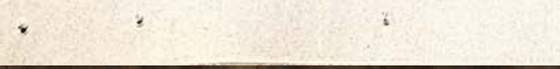
30-е. Удивительные жесты времени зрители встречали аполлоновскими