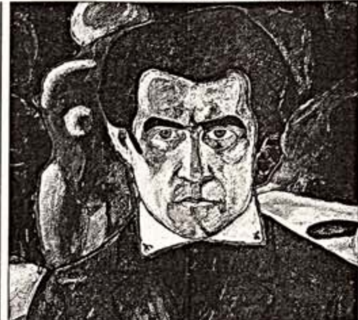
К.Маленчев. "Автопортрет". Около 1910 г. (слева) и эскиз ко Второму крестьянскому циклу. 1920-е гг.

Третьяковская галерея на Крымском Валу открыла очередной тематический сезон. Продолжить был посвящен Кузьме Петрову-Водкину, нашедший — Казимиру Малевичу. Сезон открылся сразу двумя мероприятиями — показом небольшой экспозиции недавно поступивших в собрание Третьяковской галереи графических произведений К.Малевича, Н.Сутеева и И.Чашкина и презентацией только что переизданного альбомов "Утвердители Нового Искусства". В двадцать пять рисунков супрематизма в 2002 году Невил Николаевич Сутеев, доверно художника. В России произведения экспонировались впервые (некоторые ранее выставлялись за рубежом). Деятель карандашных рисунков Малевича — кубофутуристический пейзаж, несколько супрематических композиций, эскизы литографий, несколько произведений "крестьянского цикла" — охватывают большой временной и творческой период художника от 1913-го до 1929 года. Среди представленных произведений особый интерес вызывает "Красный квадрат", который не был повторен ни в живописи, ни в графике. Илья Чашкин и Николай Сутеев представлены работами 1920-х годов, супрематическими орнаментами, эскизами контрольных набросков, эскизами архитектурных сооружений Сутеева с авантюристическими элементами. Среди рисунков — проект архитектурной композиции, эскизы литографий, эскизы рисунков, эскизы живописных систем — о том, что составляет суть легкой, статей и — шире — педагогической программы Малевича, воплощенной им в полной мере в коллективе УНОВИС (Утвердители Нового Искусства) в Витебской галерее.