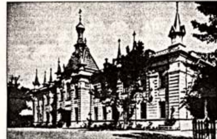
Слева: в роли Лизы в спектакле «Дворянское гнездо», 1894 г. Справа: Убежище для престарелых сценических деятелей на Петровском острове