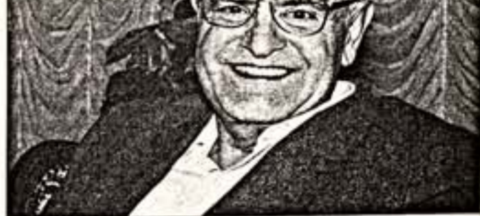
Ф. Искандеру - 75