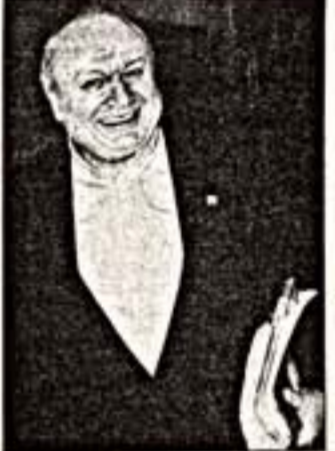
М. Жванецкому - 70

В прежние времена попасть на его концерты было почти невозможно, а достать запись - весьма затруднительно. Сегодня у него - свой сайт в Интернете, выходят книги и телепередачи. В прежние времена казалось, что он критикует французский интеллектуализм, критику советской действительности, которая в той самой действительности была возможной и исключительной как ситуация на "отдаленные" недостатки. Сегодня - советская действительность давно в прошлом, а его новеллы, эссе, монологи, в том числе и те, которые были написаны тогда, по-прежнему актуальны и совсем не устарели, просто тогда мы думали, что они об этом, а оказалось - ономом о другом, но не о другом - о том, что происходит сейчас. Он - один из немногих замечательных сатириков. В конце 90-х годов совершенно неожиданно Михаил Жванецкий занимает особое место, он уникален, не в какой роде он не выдумывает, эстрада - просто форма существования его литературного таланта, настолько органичная, что даже читая текст, повторяешь его интонации. Он большой и знаменитый русский литератор, пропагандист знаменитой традиции горького и грустного юмора. Да и сам Михаил