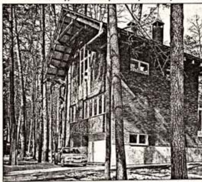
Общая от С.Павсаров