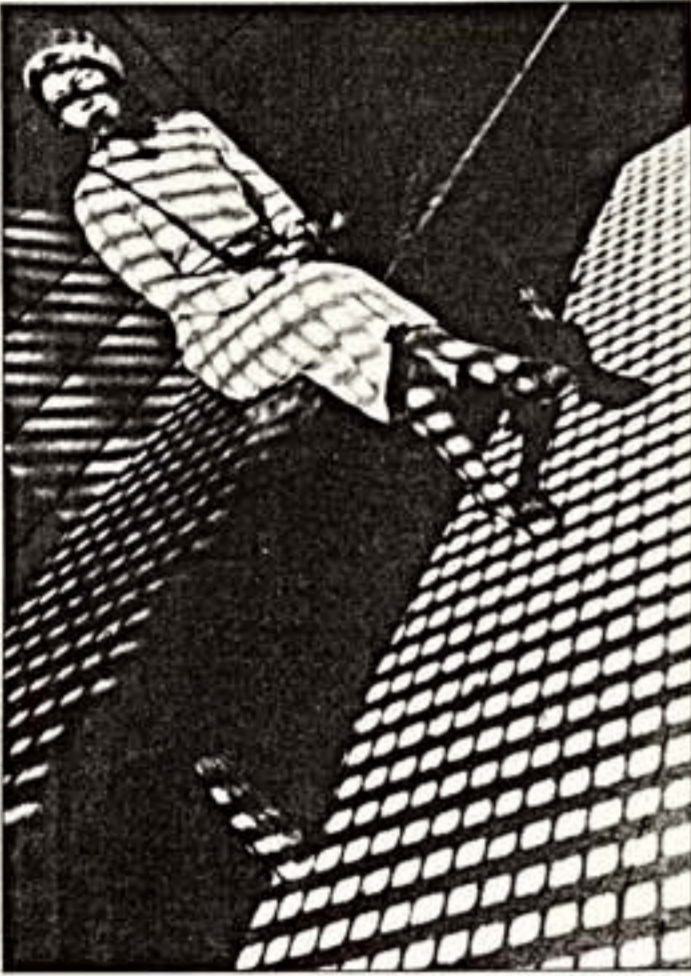
А.Родченко. "Девушка с лейкой". 1933 г.