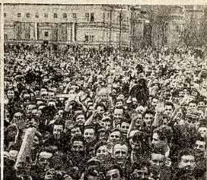
Фото специального корреспондента ТАСС В. ГОРОВА. (Снимок принят по фототелеграфу).