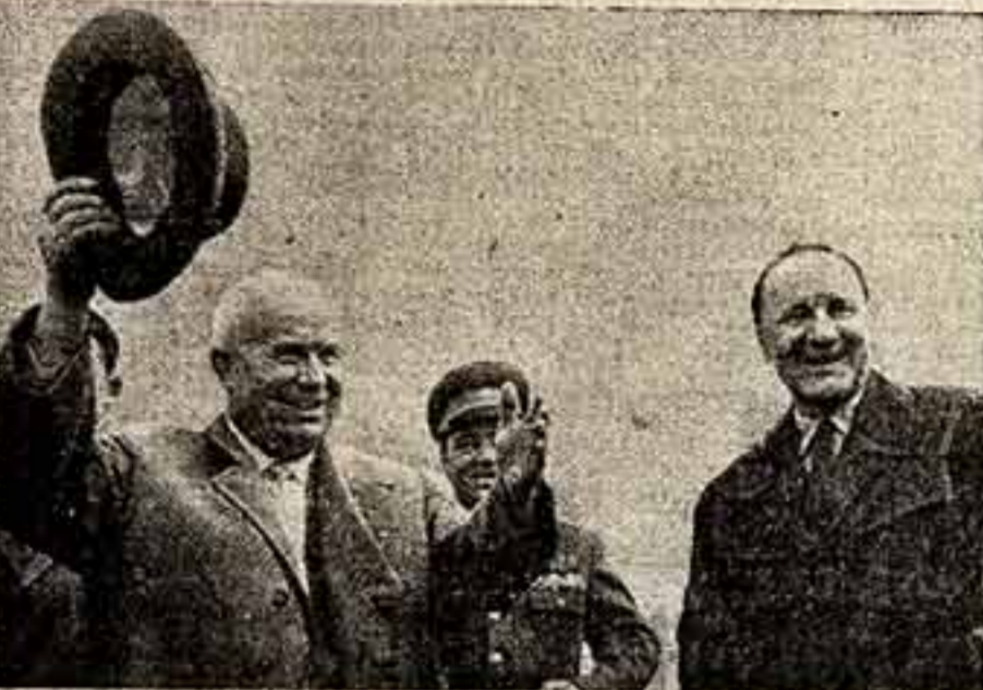
4 апреля в столице Венгрии Будапеште состоялся военный парад по случаю национального праздника — Дня освобождения. Вместе с венгерскими руководителями партии и правительства на параде присутствовали члены советской партийно-правительственной делегации во главе с Первым секретарем ЦК КПСС, Председателем Совета Министров СССР Н. С. Хрущевым. На сцене: по окончании парада, товарищи Н. С. Хрущев, Я. Кадар отвечают на приветствия трудящихся.

Дунай — река дружбы. Достаточно даже короткого рейса, чтобы еще раз почувствовать это. Живописная панорама окрестностей