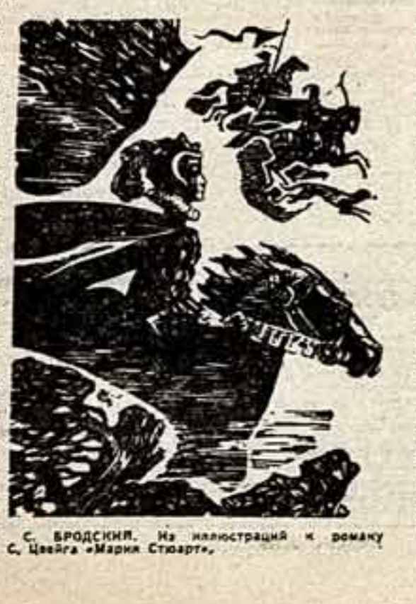
С. БРОДСКИЙ. Из иллюстрация к роману С. Цейга «Мария Стюарт».