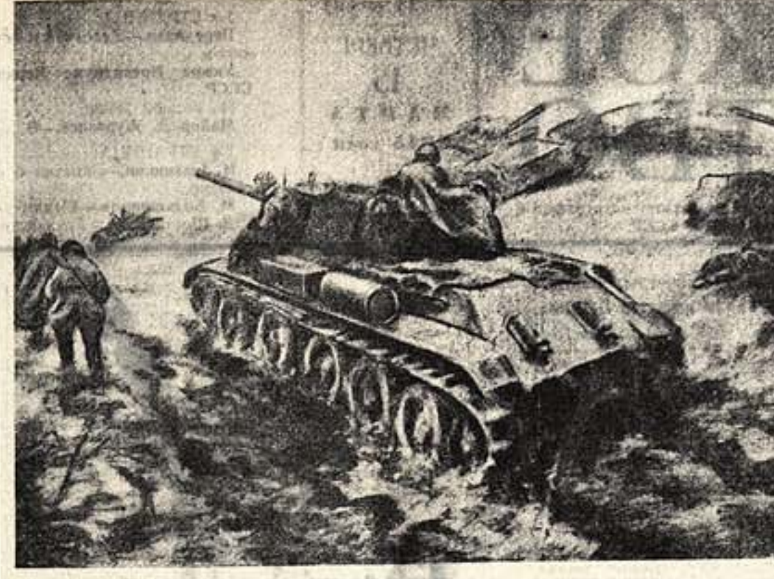
В суровом походе. Рисунок Д. ГОЛОДАНОВА. Студия военных художников им. Герцена.