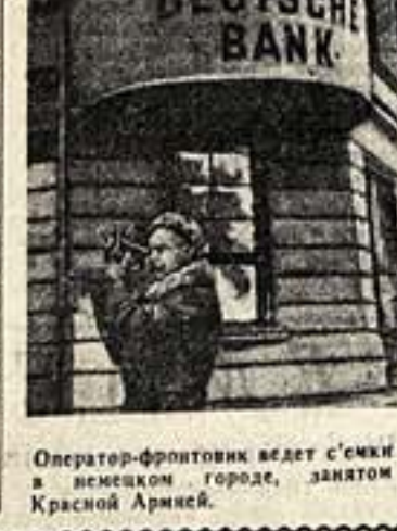
Оператор-фронтник ведет сьемку в немецком городе, захваченном Красной Армией.

Надо смело привлекать к кинооператорам способных и храбрых людей, и тогда советская кинематография получит новых, ценнейших документальный материал о боевых подвигах наших Красной Армии, громадной врага в его логове.