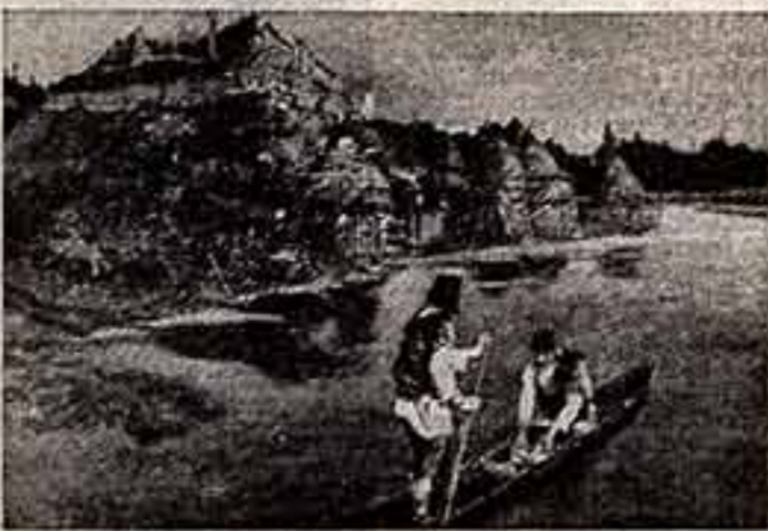
«Гонец. Восстал род на род».

ВЧЕРА В ЗАЛАХ АКАДЕМИИ ХУДОЖЕСТВ СССР ОТКРЫЛАСЬ ВЫСТАВКА ПРОИЗВЕДЕНИЙ НИКОЛАЯ КОНСТАНТИНОВИЧА РЕРИХА, ПОСВЯЩЕННАЯ 100-ЛЕТИЮ СО ДНЯ РОЖДЕНИЯ