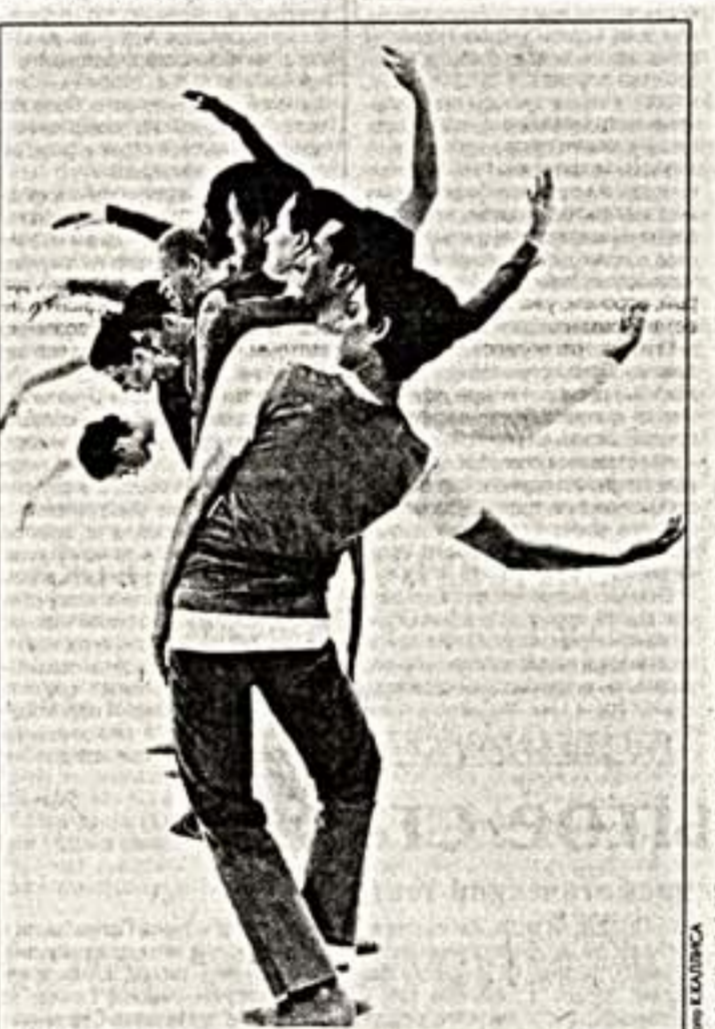
Танцевальная компания Триши Браун

Славящаяся своей живой энциклопедией, бесшумной и выразительной в движении сложившаяся перлами человеческих эмоций, она была удостоена пяти премий Нью-Йорка в области танца и исполнительского искусства (премия "Бессю").