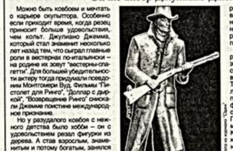
Зад. Тогда я решил "выйти из подполья". Это произошло после того, как Римская академия искусств присудила мне премию...