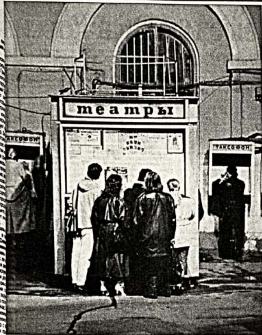
Пришел. Увидел. Победил?