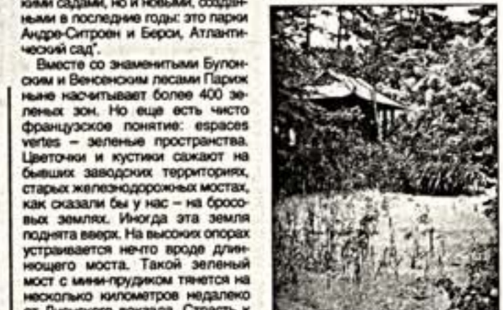
Вверху: в парке Андре-Ситрон. Внизу: в Венковском лесу