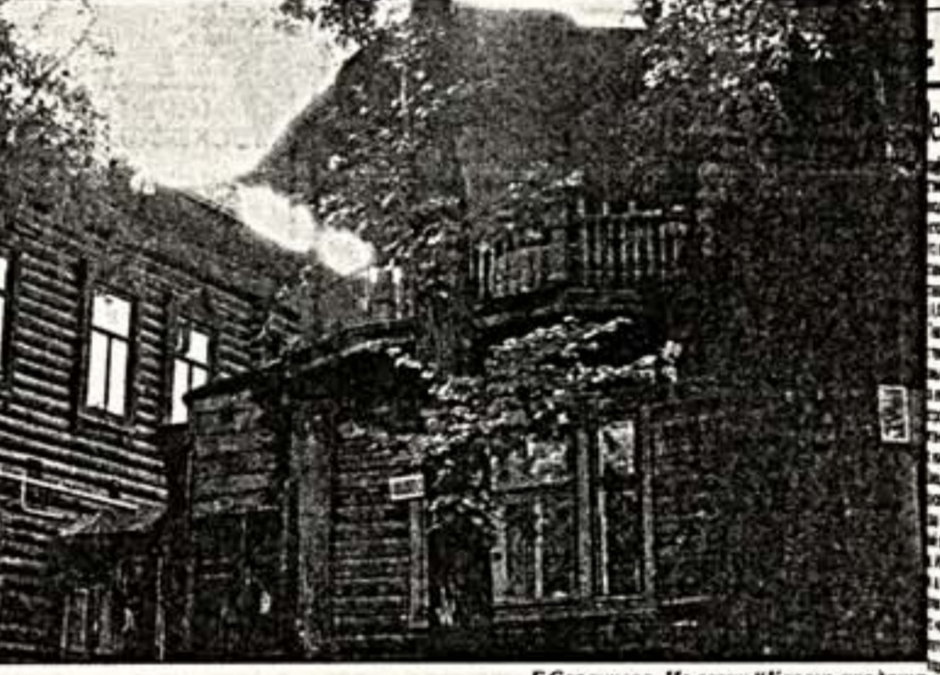
Г.Саранцева. Из серии "Казань уходит"