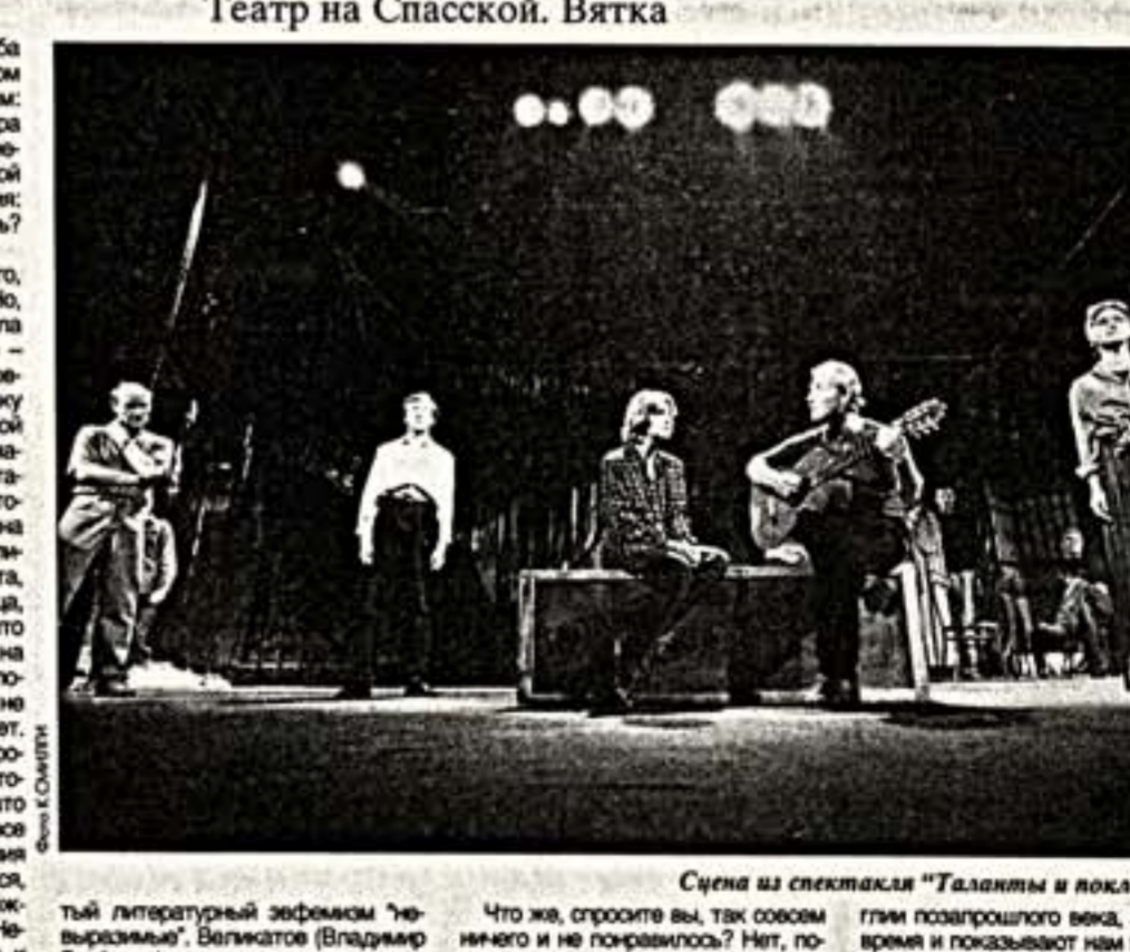
Театр на Спасской, Вятка