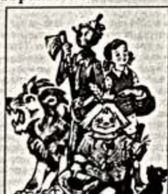
Волшебник Изумрудного города