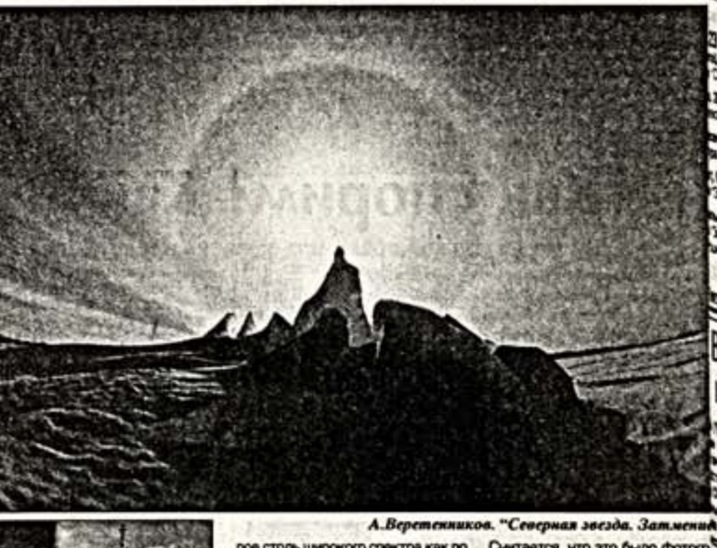
А.Веретенников. "Северная звезда. Замшевый"