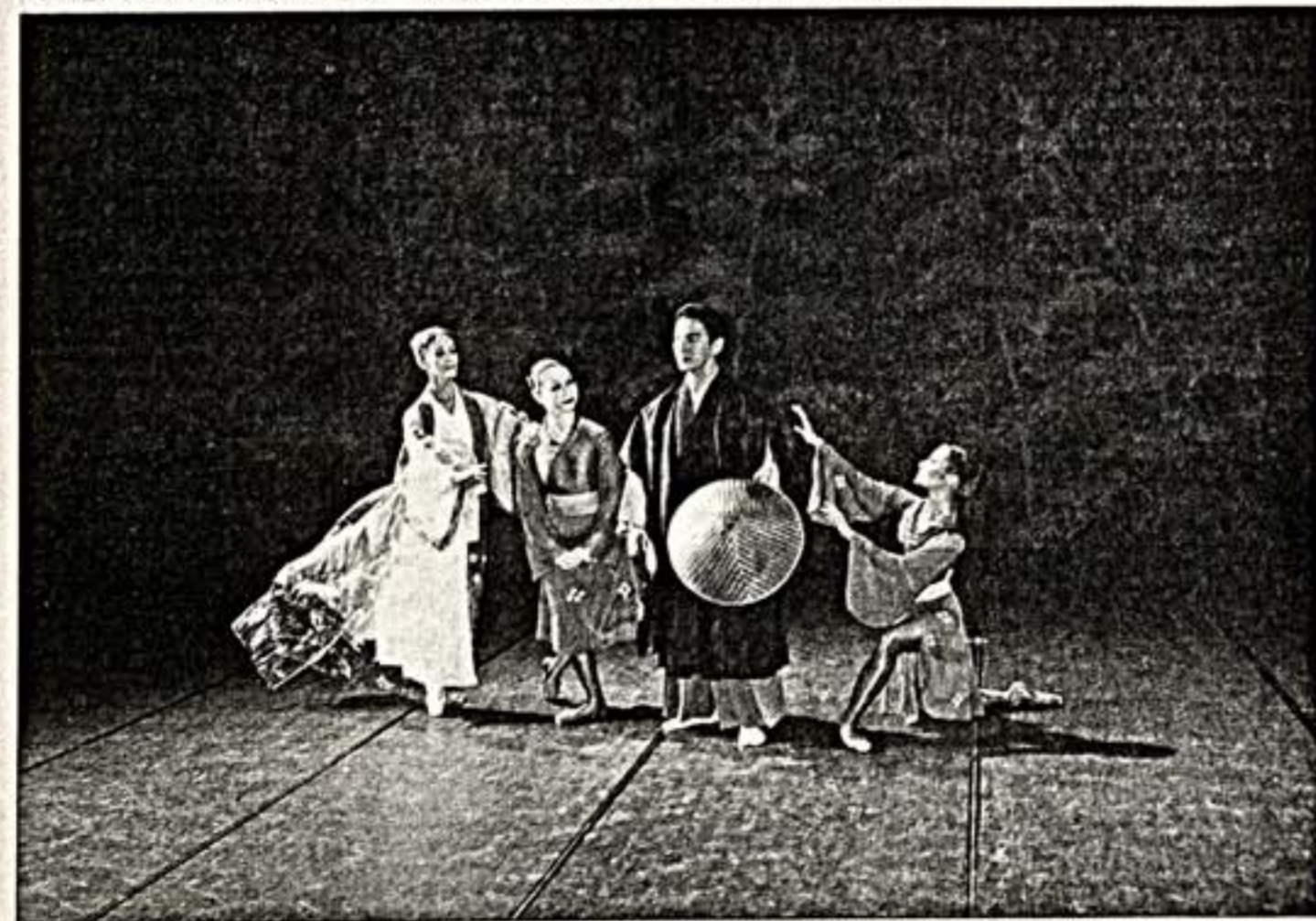
Сцена из спектакля "Сайге под дождем"

Кому были нужны и выгодны эти никчемные гастрели, тем более в начале юбилейного сезона? Безусловно, японцам, ибо престижно иметь в своем послужном списке выступление в Большом!