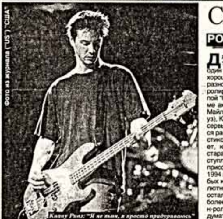
Кинью Рива: "Я не пью, я просто придурился"