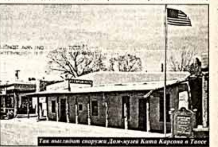
Так выглядел старушка Дом-музей Кима Карсона в Таосе