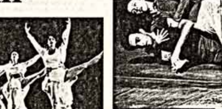
Сцена из балета "Тарп"

Резкий ритмических слов почти нет, движения словно переливаются одно в другое. Завершает спектакль балет "66-66" — номер хайпа "всеем-риканской" дороги на Запад. Карта знаменитого маршрута, воспроизведенная на заднике, выкатывается в самом начале колесо сразу настраивает зрителя на соответствующий лад. Образ дороги, движения очень важен для воплощения авторского замысла. Дорога, путешествие — это и метафора, и драматургический прием, дающий возможность соединить самые разные танцевальные сюжеты, сцены — лирические, комические, эксцентрические. Встречи, расставания, внезапно завязывающиеся романы — всего только не происходит с людьми в дороге. Но Тарп предлагает нам к чему не относиться всерьез и вкушать сладость свободного бродяжничества. (Песни столь популярных в Америке 50-60-х годов бродячих музыкантов нам, безусловно, в этом помогут). Весь балет пронизан юмором. Это настоящий каскад комических положений, причем комиков танцевальных. Три гряды, сплотившись, в какой-то степени воссоздали и историю Америки — прошел тонкий "пунктир" от истоков практически до наших дней.