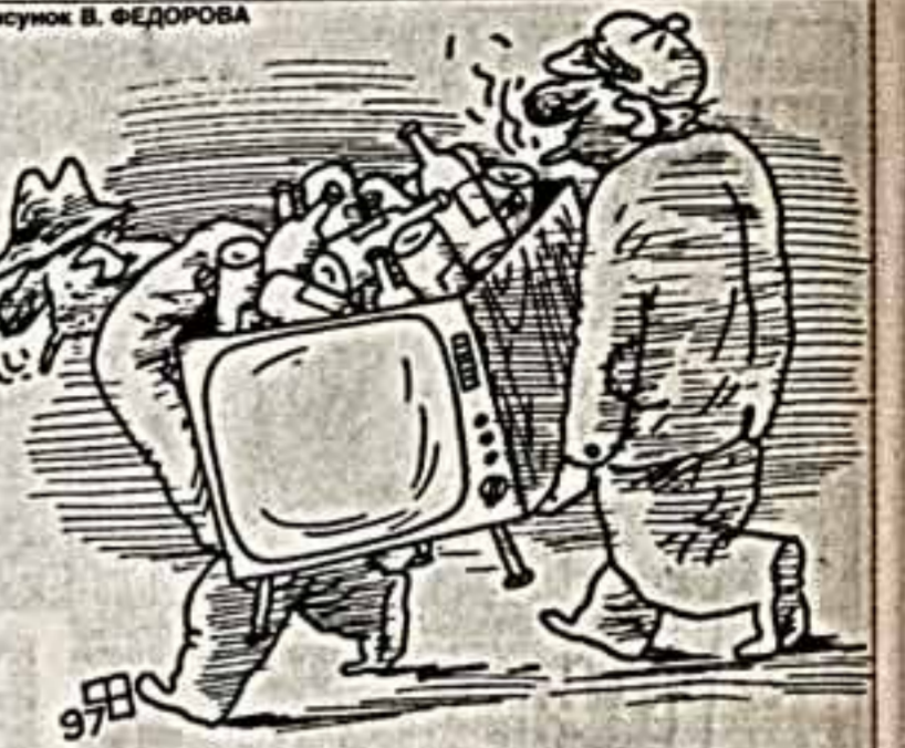
Рисунок В. ФЕДОРОВА

1 КАНАЛ 7.55 ХФ "ТЕЛЛИ И НОС" 8.30 "Сказка о Звездном Мальчике"