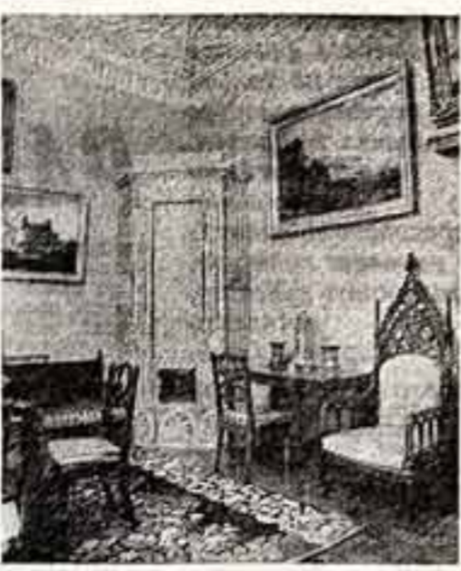
Восстановленный интерьер одного из дворцовых залов.