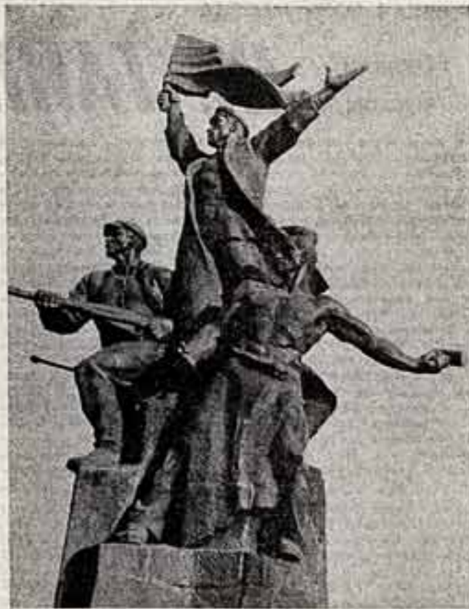
Подвигу посвящается. Памятник героям Горловского вооруженного восстания 1905 года. Автор — скульптор Владимир Ильич Ленин.