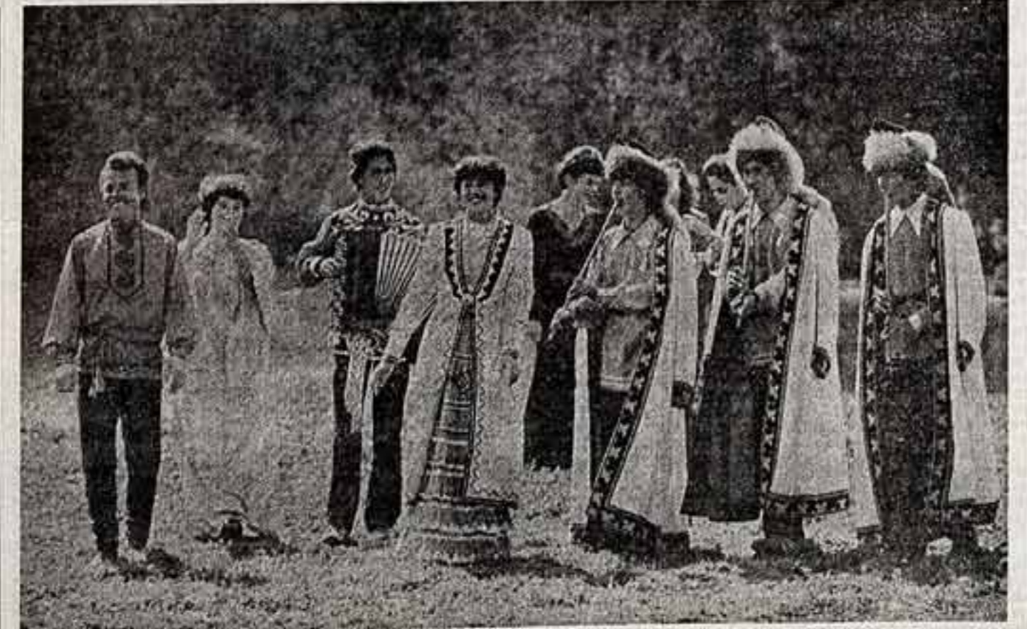
Сельские труженики Башкирии всегда рады встрече с гостями из Мелеузовского районного Дома культуры. В это время — лето, гастроль, отдых.