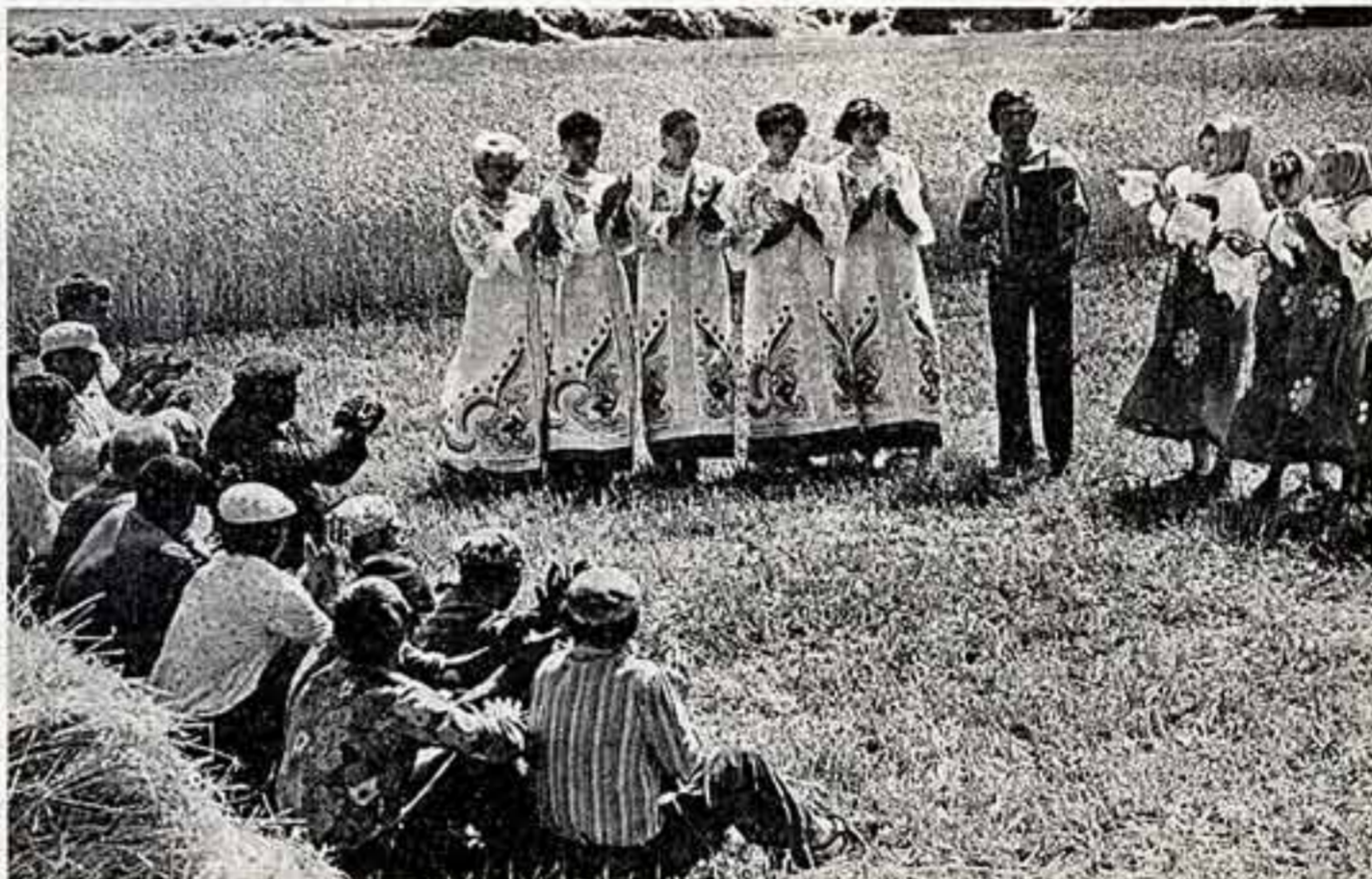
Отлично потрудились в этом году на жатке коллектив ордена Трудового Красного Знамени совхоза «Лисинский» Лисинского района Воронежской области. Это жнецовское хозяйство. Земледельцы живут в благоустроенных квартирах. Союзный Дом культуры является на все округу. Каждый день агитбригада совхоза строго по графику выступает на полях станках. С нетерпением ждут труженики полей приезда самодеятельных артистов.

В центре Чебоксар, среди многоэтажных современных домов, вырос теремок, займется украшением деревенских кружев. У ворот на деревню пропускать беспрепятственно. На днях строители — шефы мкрорайона армийским полкоманам символический ключ от сказочного городка, заселенного персонажами любимых книг. Деревянные скульптуры мастерицы с помощью местных умельцев художники-орформисты города. Такие игровые площадки появились в последнее время во всех районах столицы Чувашии.