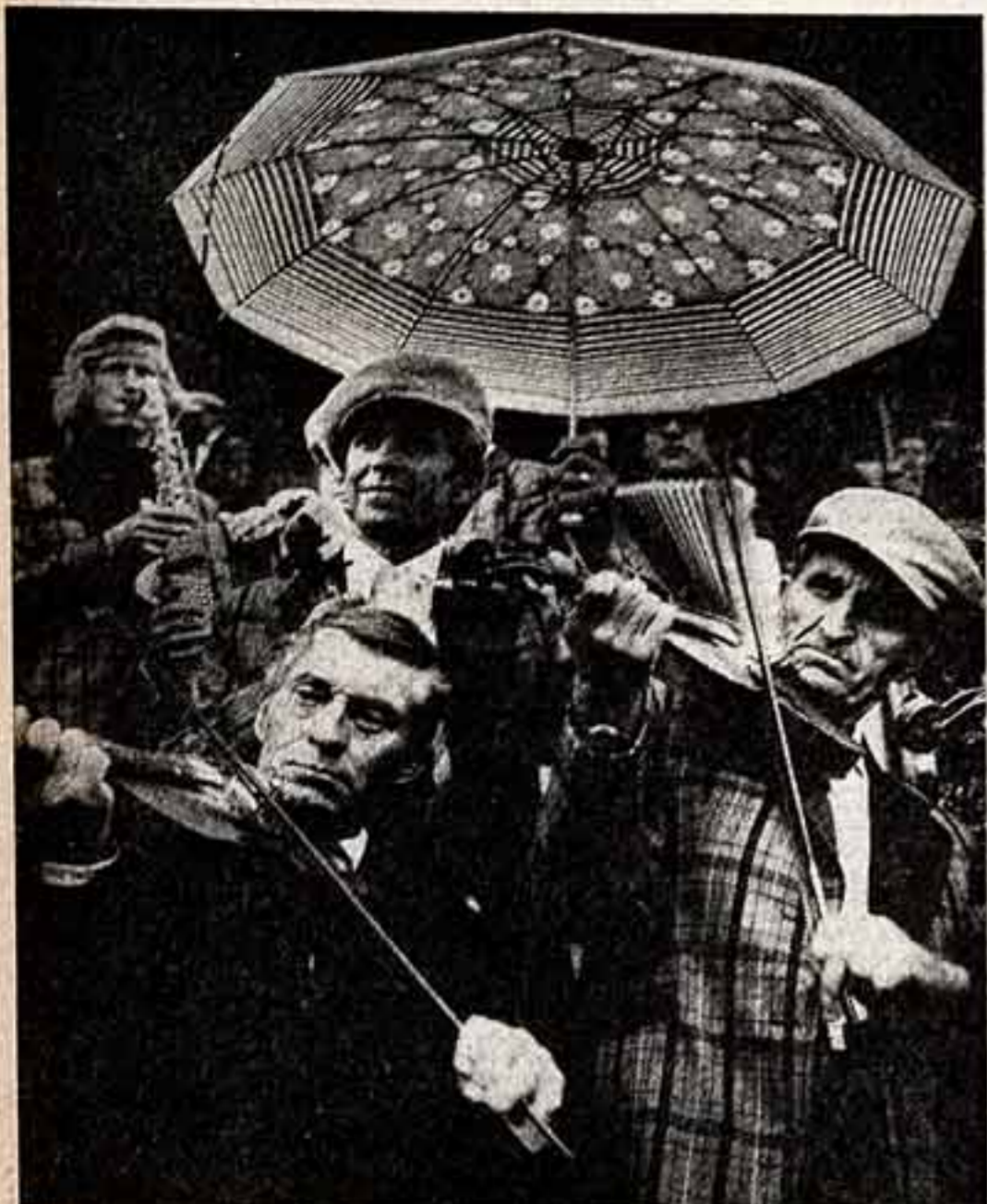
ФОТОКУРС ● П. КАТАУСКАС. «Праздничная увертюра». ● Ю. МАКСИМОВ. «Деревенский натюрморт».