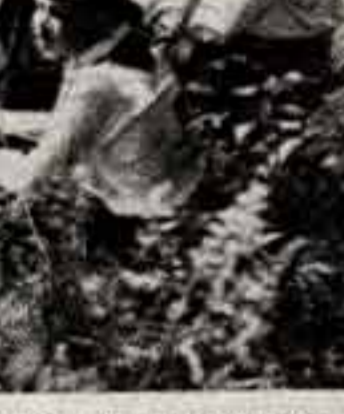
Завершается инженерное лето...