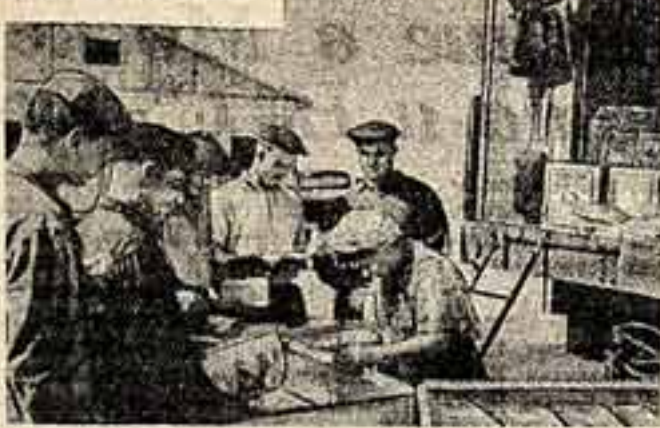
На снимке: рабочие Бурятского зерносовхоза покупают книги в автолавке.