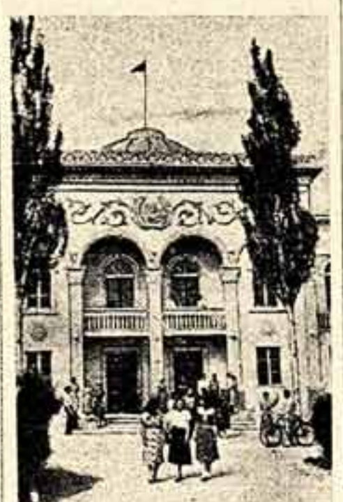
Казахская ССР. В Чинкиском таебно-лесном совхозе Алма-Атинской области заканчиваются отделочные работы в новом доме культуры.

На снимке: главный фасад дома культуры.