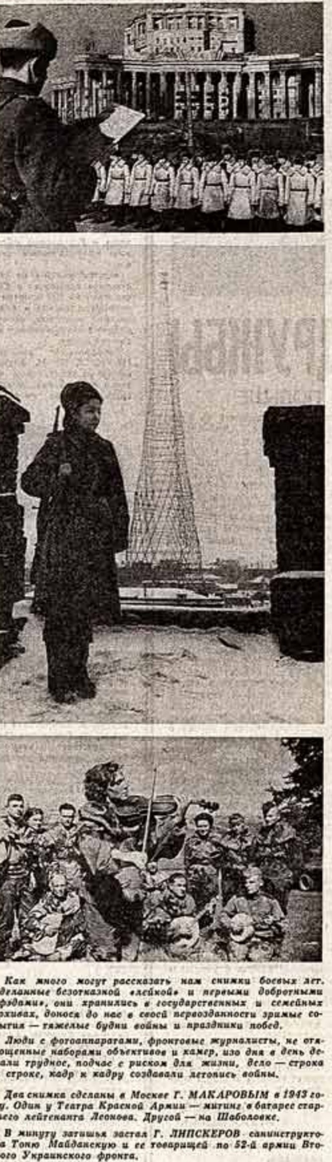
Как много можно рассказать нам снимки боевых лет. Служащие безотказно «летают» и первые «взбрызгивают» врага, они хранились в государственном и семейных архивах, выкопаны до нас в своей первоначальной зримости — тажежте буди войны и разлывки побед.