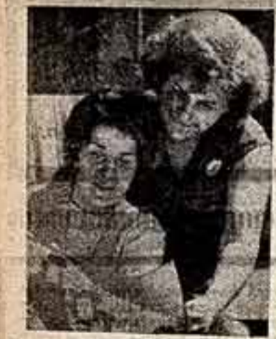
Народная артистка СССР Татевик САХАДЯРИАН