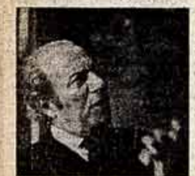
Народный художник Армянской ССР Эванд КОЧАР