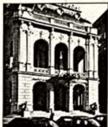
Оперные театры столь же точно отражают линии европейских городов, как и многочисленные храмы и базилики.

в новый, похожий на старый, театр Карловых Вар