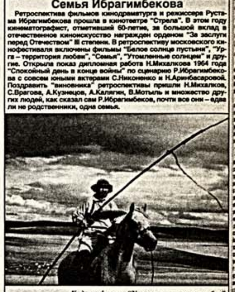
Кадр из фильма «Урга - территория любви»