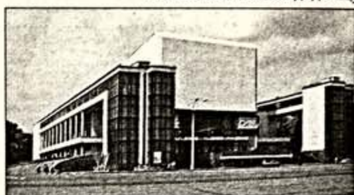
Спасибо вам за то, что вы вернули нас в наше прекрасное прошлое! Курьез? Да нет, просто недюжинность нашего прошлого и настоящего. Подорожные спектакли Марка Розовского в жизни, горький анекдот про нашу "шоу-талию".

На завершившемся II Всероссийском фестивале "Русская комедия" раздавали именные призы. Приз имени Эраста Гарина - "За оригинальность и эксцентрику", приз имени Фаины Раневской - "За яркость комедийного рисунка", приз имени Андрея Миронова - "За музыкальность и пластичность".