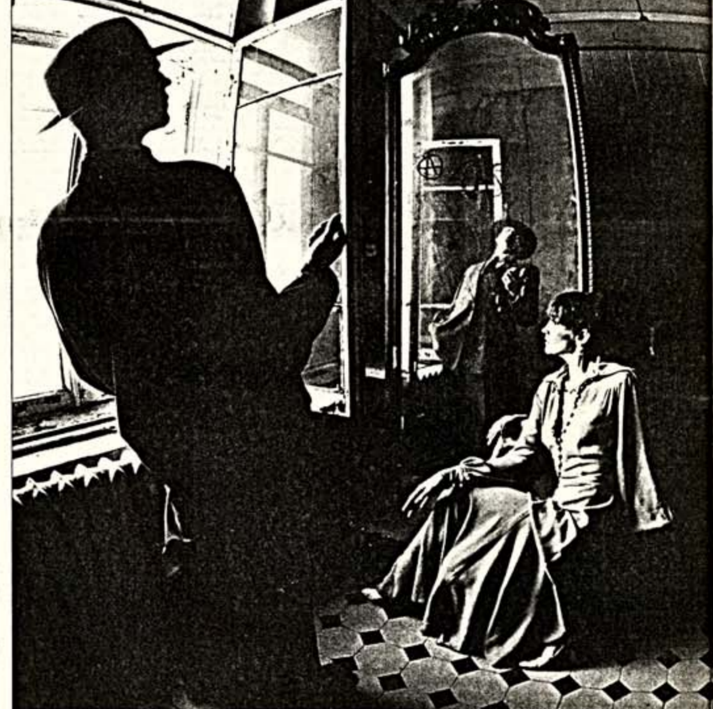
Сцена из спектакля "Три легенды" по произведениям А. Чехова

А еще утвердилась практика оброка для средств массовой информации. Хотите заполучить интервью звездной звезды для газеты, "задавать" беседа в живом эфире на телевидение - отработайте рек-