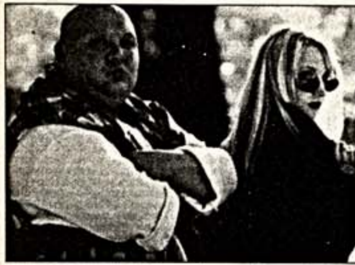
Кадры из фильмов «Страсть», «Фара»

Название одной из лент внеконкурсной программы очень символично — «Богини и монстры». Этот фильм рассказывает о создателе первого фильма о Франклинштейне, режиссере Диконе Вейле. Кажется, что ныне не только герои, но и создатели, и актеры, их имиджи наравне с сюжетами и идеями формируют восприятие фильмов. Вот, например, появление Катрин Денев в экстравагантной роли в экстравагантном фильме «Теща», где легендарная кинодива играет женщиной, столь победительной красотой, что жертвой ее чар становится жених ее дочери. Чем не фильм о мифе Катрин Денев? Во всяком случае, уж точно это «фильм Денев». То же самое можно сказать и о другом звезде внеконкурсной программы, фильме Лео Каракса «Тюла Х», где Денев также появляется в аналогичной и отнюдь не возрастной роли матери главного героя, чем духовная биография этого героя, его «кинематографическая родословная» обозначены лучше всяких драматургических ходов и монологов, тем более что в роли сына — Гийом Депардье, сын «того самого» Жерара.