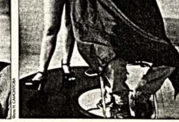
Справа: одна из работ Пэт Йорк, выставленных в Мансже.