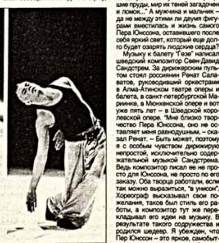
Пер Юнссон. 1998 г.