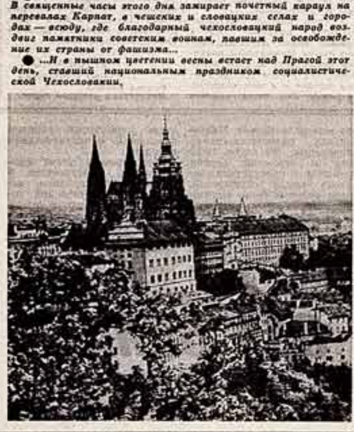
В Праге в этот день встает над городом знамя Победы, ставший национальным праздником социалистической Чехословакии.