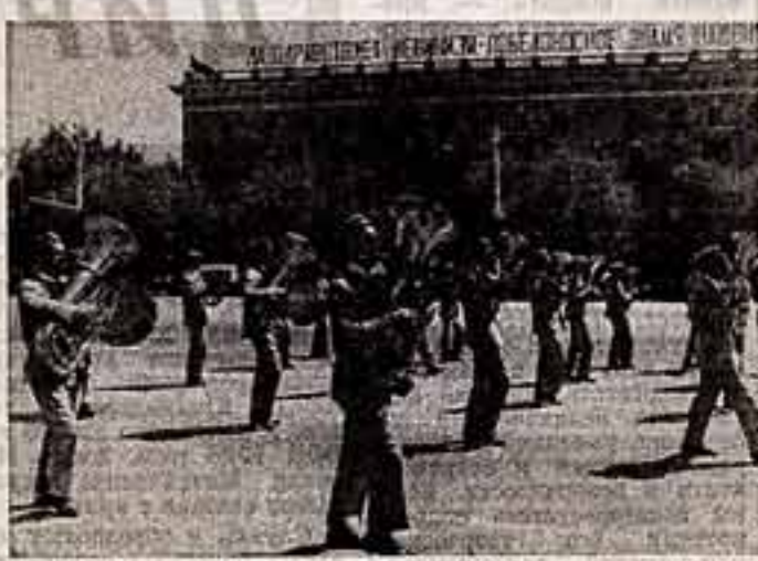
● Марш-парад своего духового оркестра города Таганрога открыл сорок девятидневный конкурс. ● Музыканты женского духового оркестра торжокской фабрики им. 8 Марта. ● На главной улице Ростова-на-Дону.