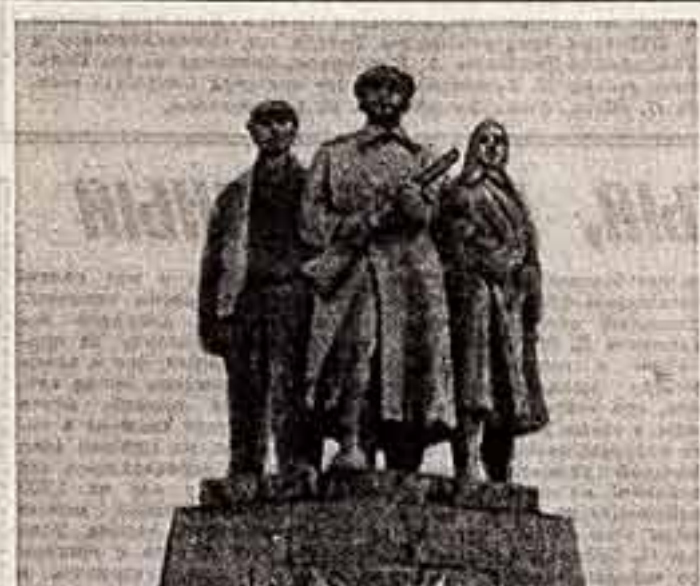
Девятое мая для Чехословакии — символ Свободы. В этот день здесь замирает пыльный караван на перевале Карпат...