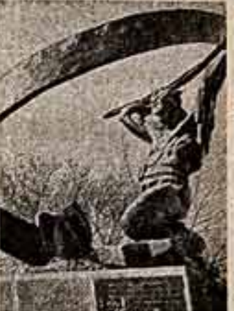
Лампачинские пожарники в Грозном, победив при тушении пожаров в военном 1942 году. Скульптор Р. Мажилов.