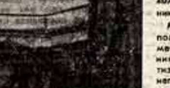
На выставке, посвященной 150-летию Отечественной войны 1812 года.