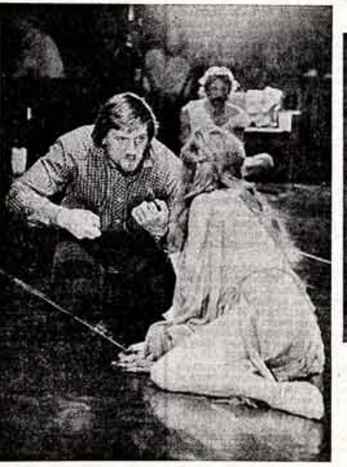
Владимир ВАСИЛЬЕВ, народный артист СССР, лауреат Ленинской премии.