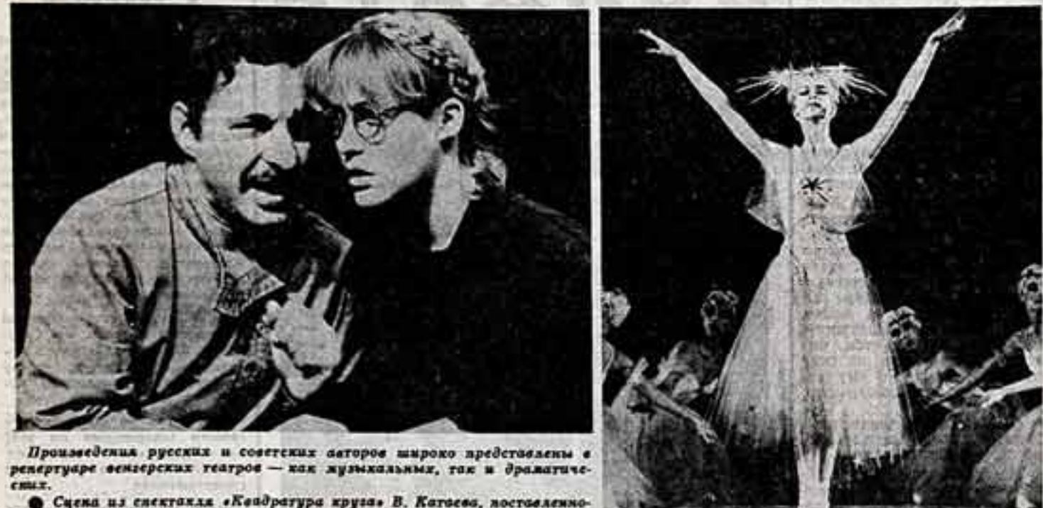
Произведения русских и советских авторов широко представлены в репертуаре венгерских театров — как хуманных, так и драматических.

Сцена из спектакля «Кавалеры ружья» В. Катаева, постановка столичного Национального театра.