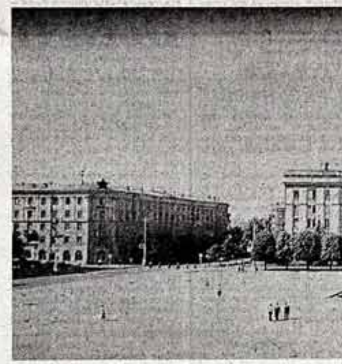
Музей имени А. С. Пушкина в Воронеже