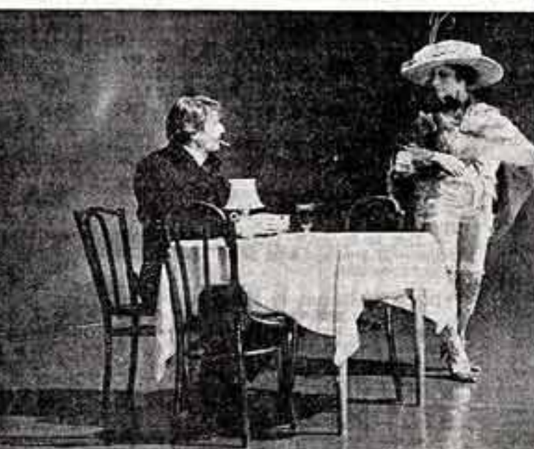
Трудная задача стоит перед постановщиками телевизионного фильма-балета, рассказывающего о творчестве из трагической жизни известного литовского художника М. К. Чорнисаса...