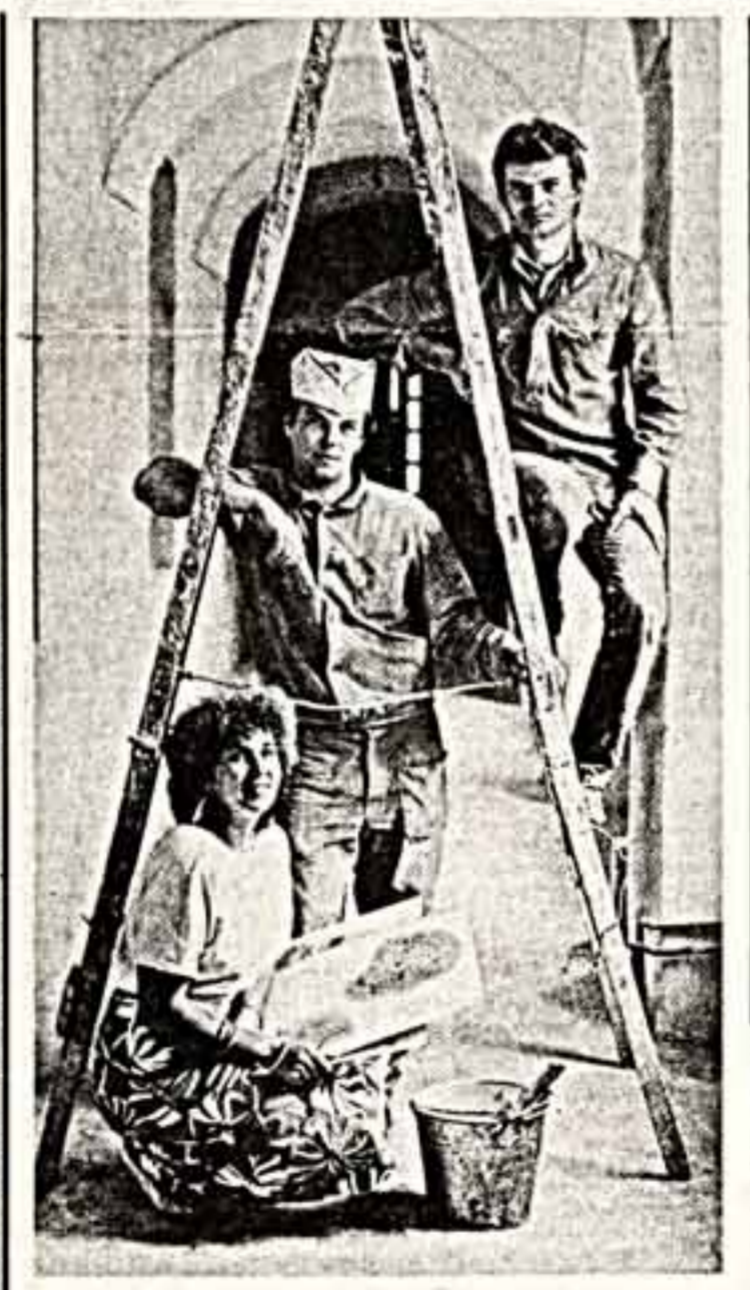
В Ужгородском замке — памятник истории и архитектуры XIII—XVIII веков — ведутся реставрационные работы. В нем размещен Закарпатский областной краеведческий музей, который и сейчас продолжает работу.