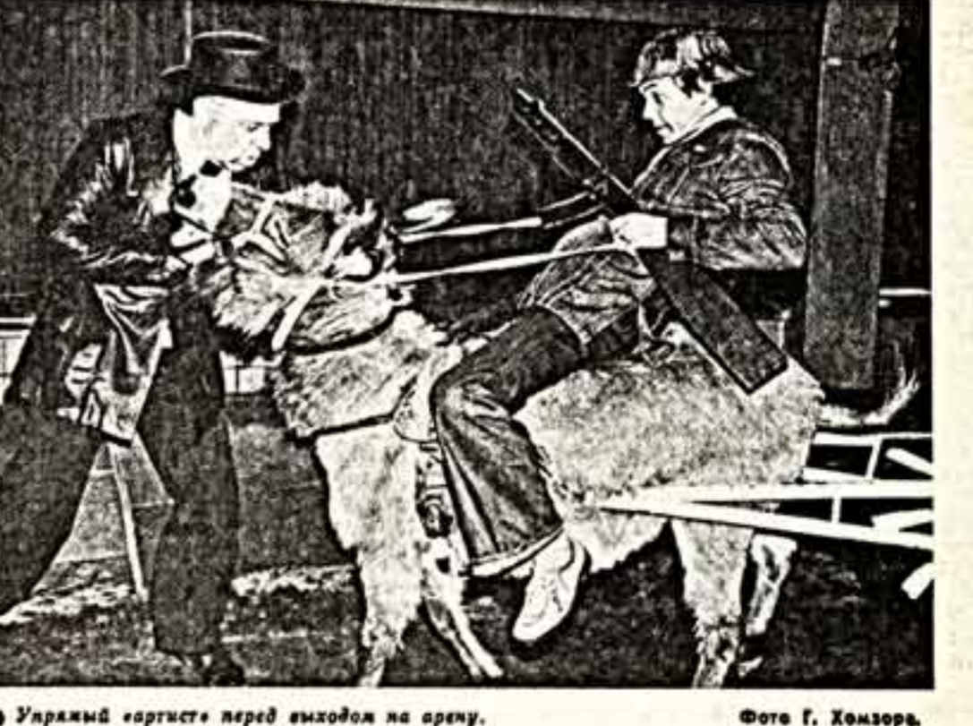
Урамы артисте перед выходом на арену.