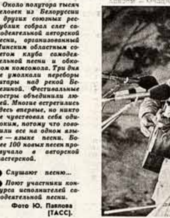
Около полутора тысяч человек из Белоруссии и других союзных республик собрали слет самодельной авторской песни, организованный Минским областным советом клуба самодельной песни и обкома комсомола. Три дня в урочище перербы гитары над рекой Березинкой. Фестивальные костры объединили людей. Многие встретились здесь впервые, но никто не чувствовал себя одиноким, потому что говорили все на одном языке — языке песни. Более 100 новых песен прозвучало в авторской мастерской.

В. ГОГОЛЕВ, начальник производственно-диспетчерского управления Минлегпрома РСФСР.