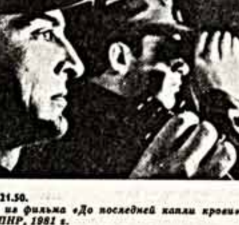
Кадр из фильма «До последней капли крови».