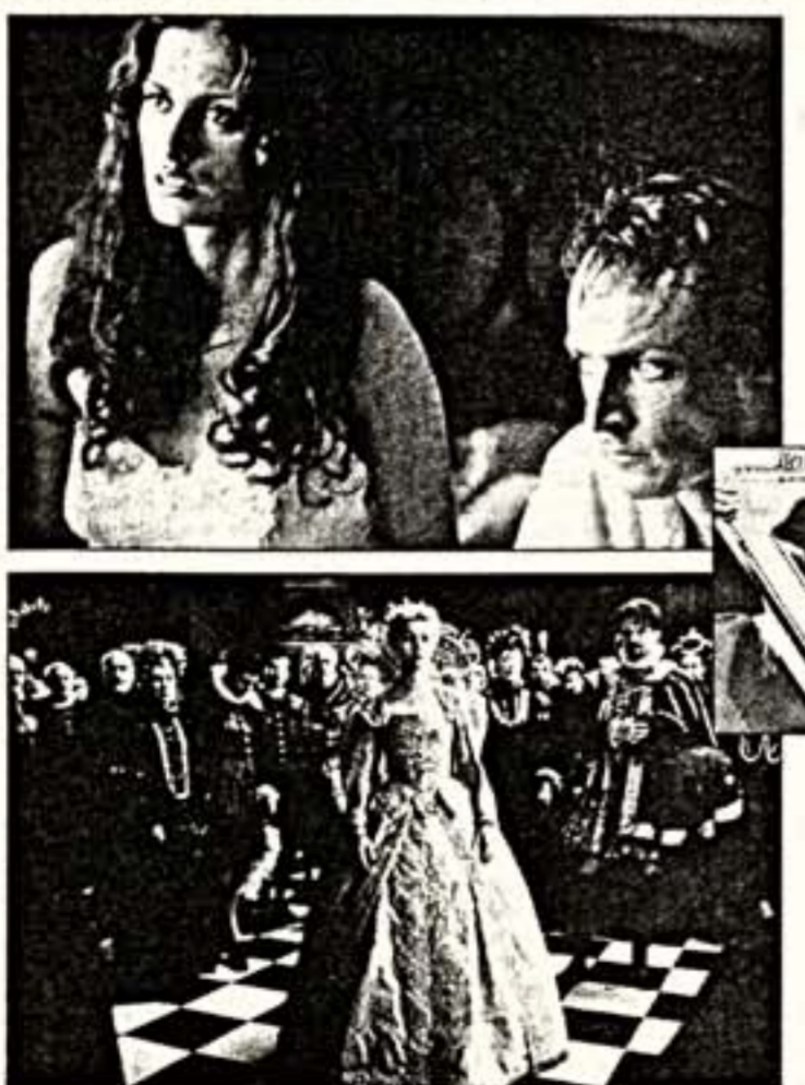
Верху: кадр из фильма "Девушка твоей мечты". Внизу: кадр из фильма "Влюбленный Шекспир"