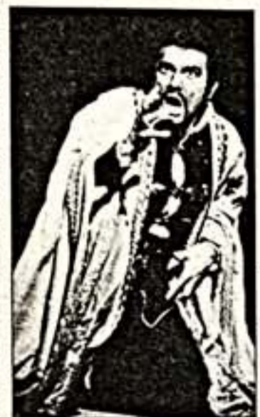
П. Доминго в роли "Отелло"