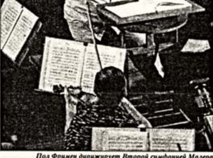
Пол Фримен дирижирует Второй симфонией Малера