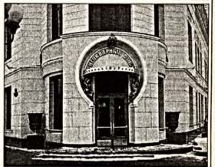
Сверху вниз: На VI антикварном салоне. Вход в новый зал магазина "Традиция и личность" в здании ресторана "Прага". Интерьер одного из торговых залов магазина "Рапсодия" в Санкт-Петербурге.