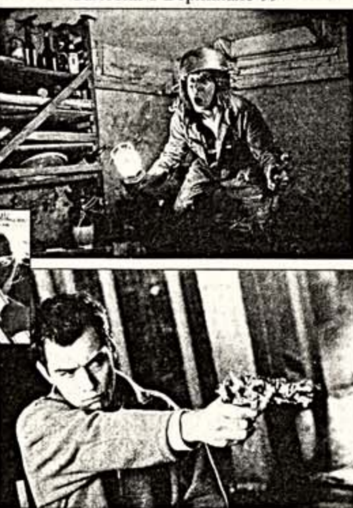
Верху: кадр из фильма "Мифуне - последняя песня". Внизу: кадр из фильма "Existenz"