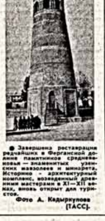
Завершена реставрация рязанских восточных донжонных срубов...