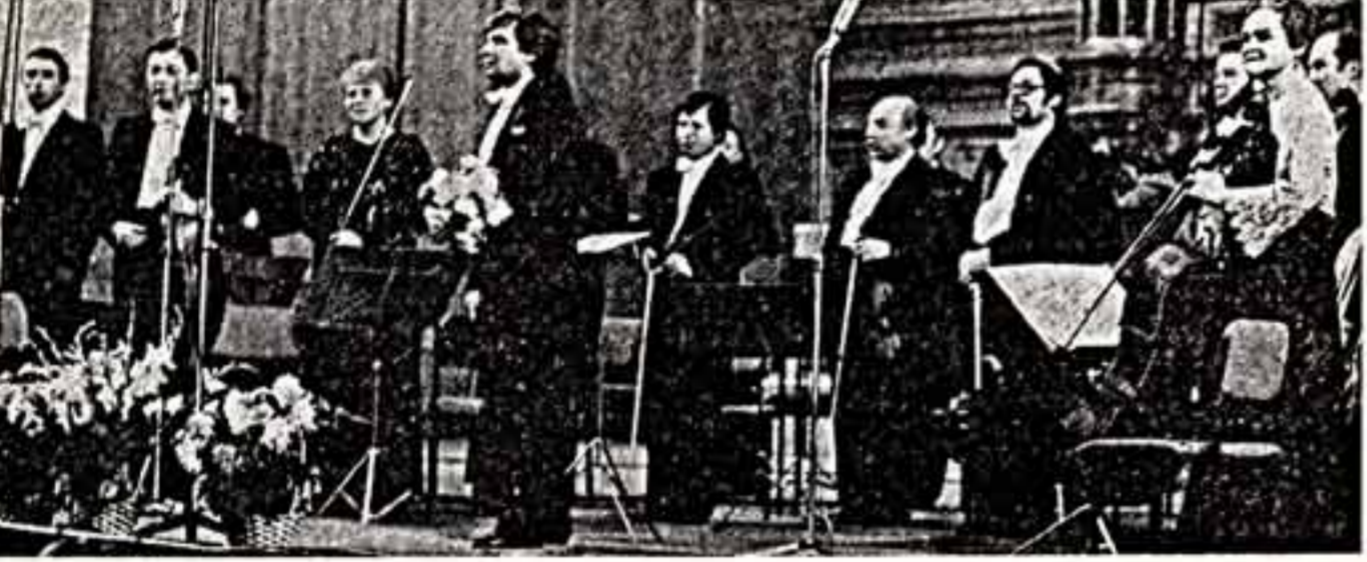
Галлина БАРИНОВА, профессор, дирижер Государственной премии СССР.