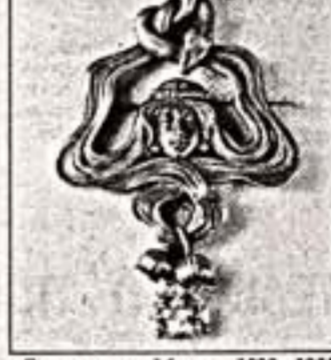
Брошь-кулон. Москва, 1899-1908. Фабрика К. Фаберже