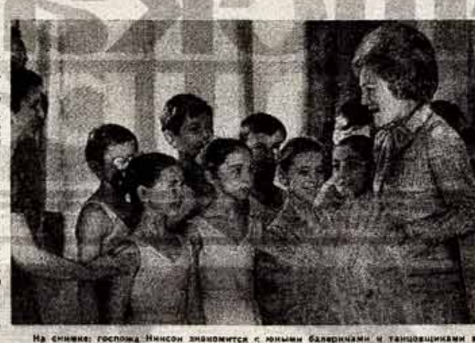
На снимке: госпожа Никсон знакомится с юными балеринами и танцовщицами во время посещения училища.